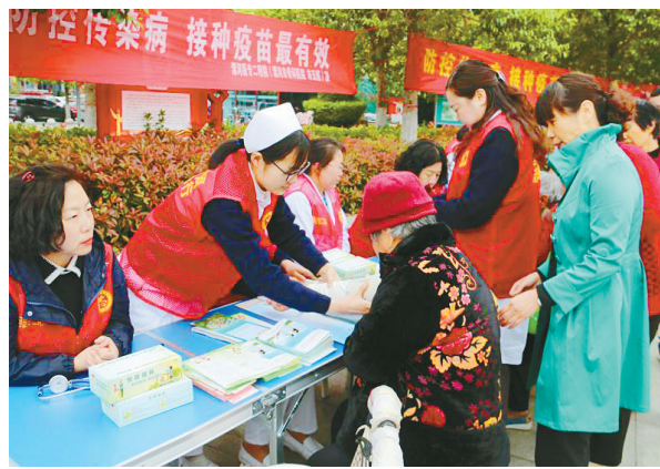
医务人员向市民宣传疫苗接种知识,并免费为市民量血压。