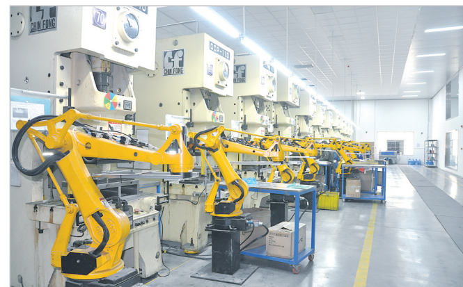
源德福科技机械臂五金冲压生产线