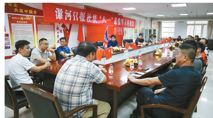
8月1日下午，漯河日报社举办“八一”退役军人座谈会。31名退役军人齐聚一堂，忆往事，抒情怀。报社领导向退役军人致以节日的祝贺，同时希望他们继续发扬军人的优良作风，为报社的事业增砖添瓦。

国家明令淘汰的用水器具为螺旋升降式铸铁水嘴、铸铁截止阀、进水口低于溢流口水嘴配件、上导向直落式便器水箱配件和一次冲洗水量在6升以上的便器五类产品。 该局抓住检查时机，向商户普及节水器具相关知识，发放宣传资料，广泛深入宣传有关节水的方针政策和法律法规，引导规范经营者销售节水器具，进一步提高全社会的节水意识。