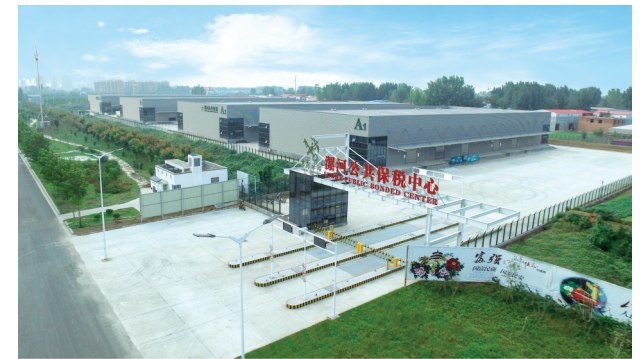
智能物联港公共保税中心