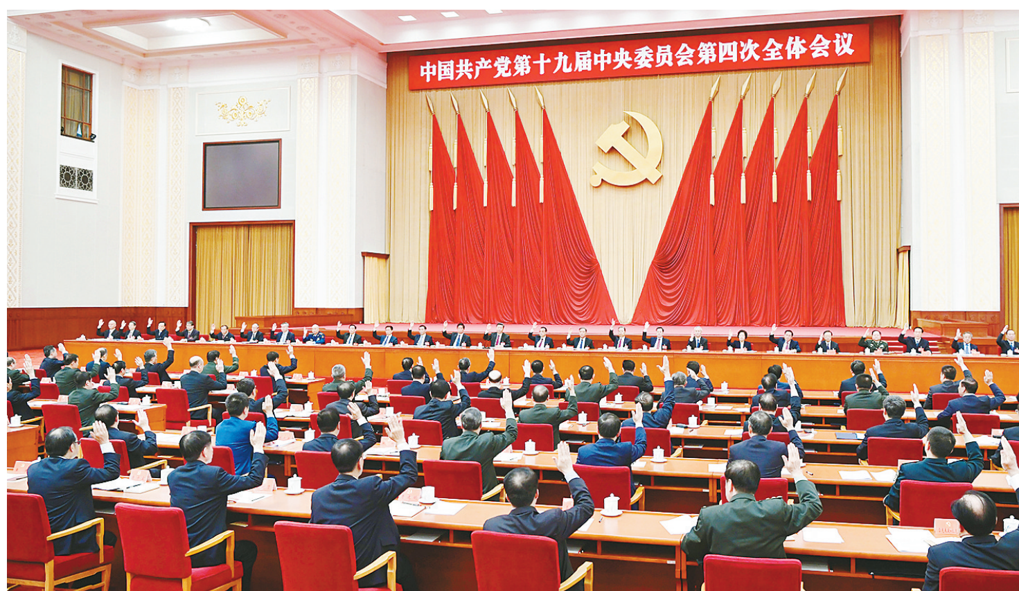
中国共产党第十九届中央委员会第四次全体会议,于2019年10月28日至31日在北京举行。中央委员会总书记习近平作重要讲话。