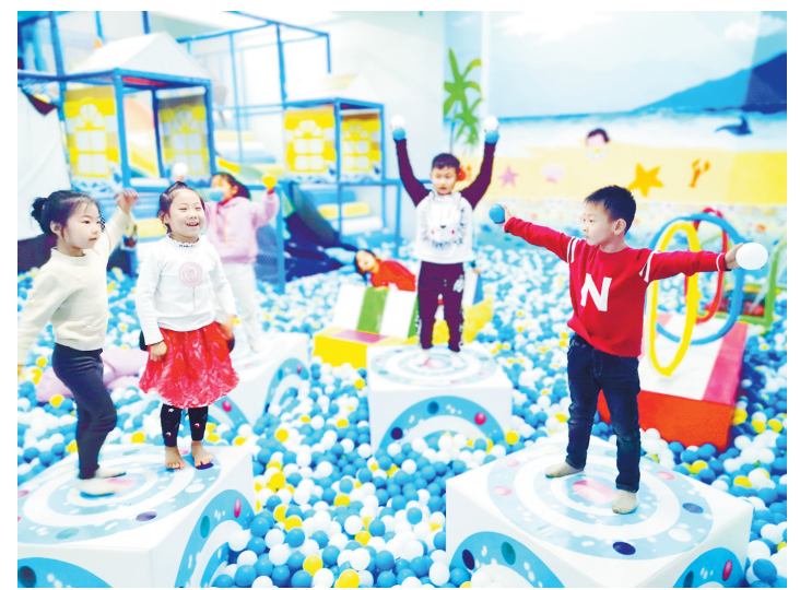
11月9日, 漯河日报社小记者俱乐部联合苏荷·象湾壹号举行亲子活动。