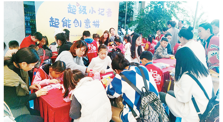
11月9日, 70余个小记者家庭到昌建·苏荷花千树售楼处开展“超能创意拼”活动。