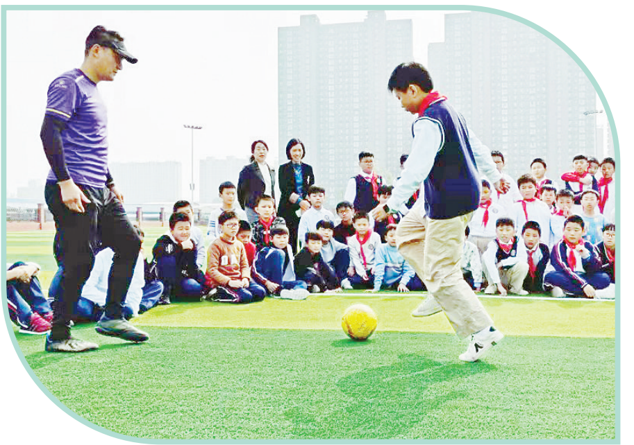
11月8日, 郾城小学聘请漯河日报社少年足球队教练员担任校外足球辅导员。图为教练员正在选拔队员。