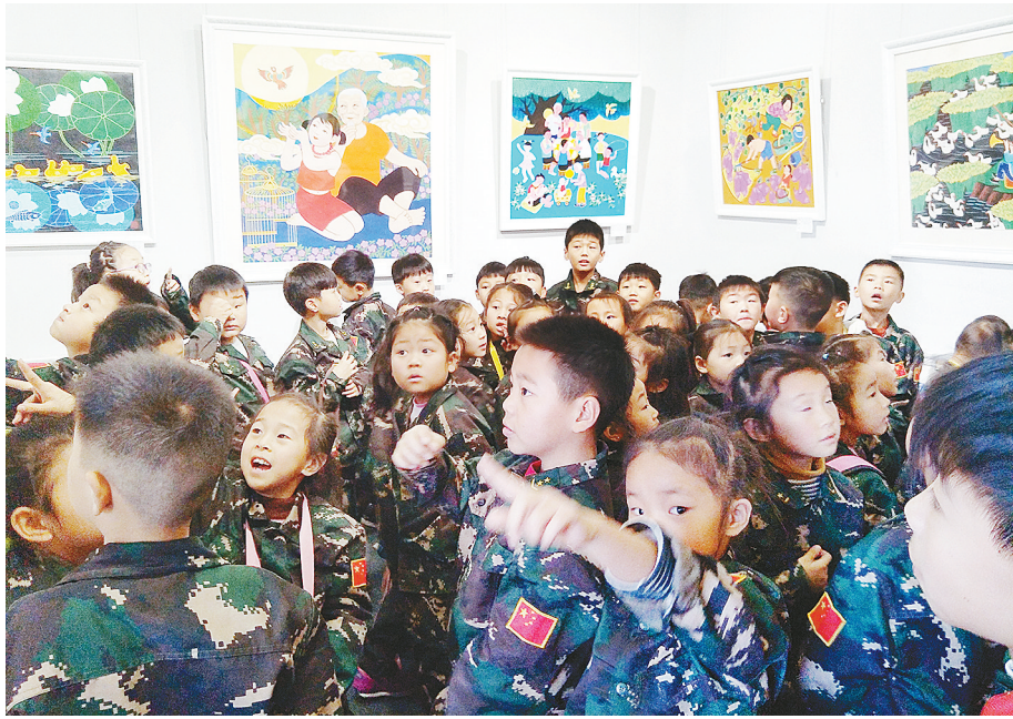
小记者参观舞阳农民画展示传承馆。