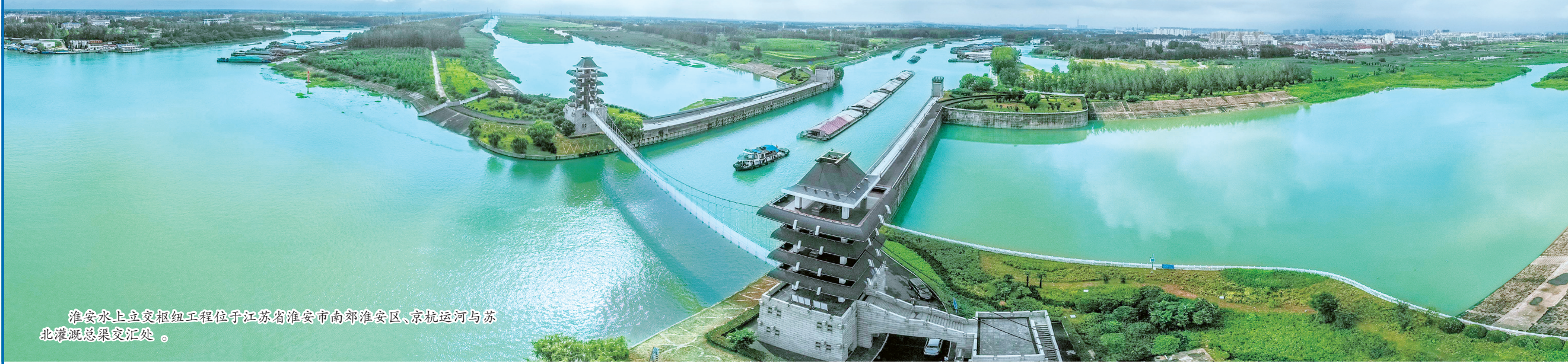
淮安水上立交枢纽工程位于江苏省淮安市南郊淮安区、京杭运河与苏北灌溉总渠交汇处。

滋养了淮安的大运河,也书写了淮安历史的繁华和荣耀。淮安拥有多项“运河之最”——世界上最大的河坝洪泽湖大堤、亚洲最大的水上立交淮安枢纽工程、中国大运河最古老的航道古泗水、中国大运河仅存的保存完好的古闸清江大闸、中国大运河最具科技含量的枢纽工程清口枢纽。淮安人说,想领略运河之都的魅力,最简单的就是到里运河文化长廊“散散步、坐坐船”。夜色下的里运河清波涟漪,沿岸亭台桥榭掩映其间,画舫游船荡漾水中。采风团成员分批登上仿古游船,看秀丽美景,品深厚底蕴,近距离感受淮安独特的魅力。