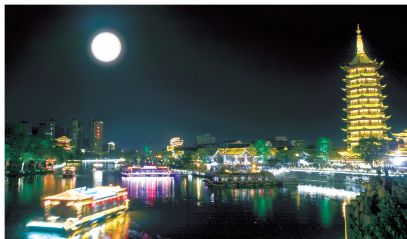
淮安里运河文化长廊风光带夜景。

载漕运的运河更加繁荣。如今的京杭运河两淮段是世界上最繁忙的内河航道之一,盐河、淮河、洪泽湖等重要航道在境内交汇,京杭大运河纵贯南北,淮安形成了经盐河对接连云港、经运河长江直达上海的两大出海口。全市共有航道1483公里,共有港区7个、码头124座、泊位390个,境内干线航道可常年通行1000吨级以上船舶,2019年,相继开通了淮安至周口水运集装箱航线和淮安至宁波港海铁联运班列。