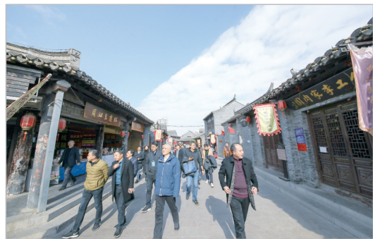
采风团成员参观淮安千年古镇——河下古镇。

运河之都淮安,因河而生、因漕而兴。从隋唐到明清,淮安一直是大运河上的漕运枢纽。中国漕运博物馆运用现代化技术,完整地展现着漕运古迹和运河历史。虽然漕运已经成为历史,但漕运给淮安留下了丰厚的文化遗产却让后人受益匪浅,使承