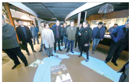
采风团成员参观中国漕运博物馆。

淮安,位于江苏省中北部,地处我国“秦岭—淮河”南北分界线上,古淮河与京杭大运河的交汇处,有“中国运河之都”的美誉。11月29日,“淮河报盟总编记者看淮安”融媒体外宣行动采风团一行走进河下古镇、吴承恩故居、沈坤状元府、淮安府署、中国漕运博物馆、里运河文化长廊等地,实地感受淮安的历史人文、自然风光,用文字、镜头记录一个个美丽的瞬间。