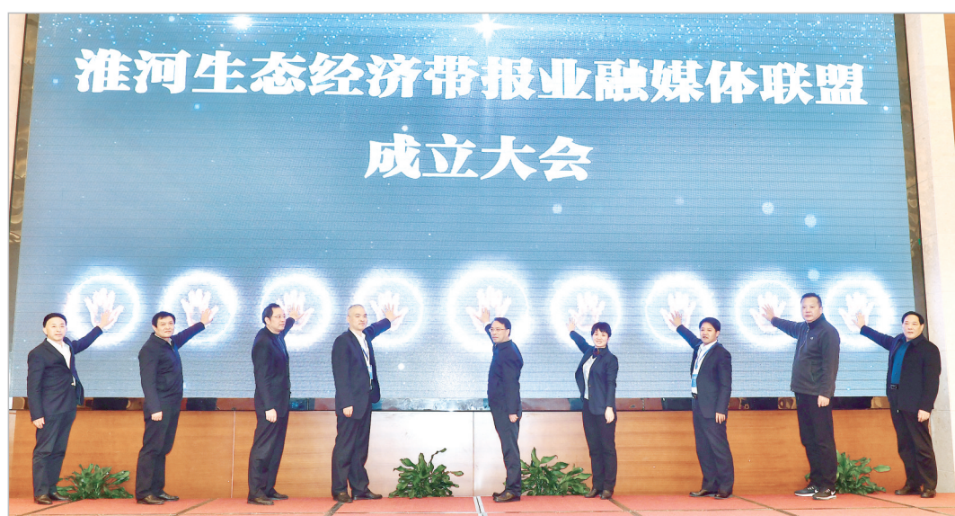
参会代表共同触摸启动屏,宣告淮河报盟成立。

随着淮河生态经济带发展上升为国家战略,淮河沿线各城市携手合作、共谋发展,全面推动产业互补、信息互享、交通互联和服务互通。在此过程中,沿淮各市的主流媒体发挥了凝聚人心、扩大共识、促进交流、引领合作的重要作用。淮河报盟就是以淮河生态经济带城市党报(报业集团)为理事单位,集联合性、专业性、行为性为一体的非营利性民间组织,旨在充分发挥新闻媒体在淮河