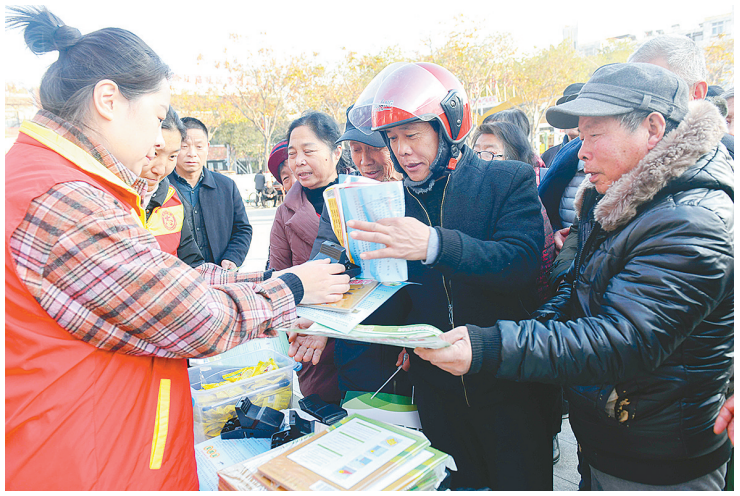
12月4日下午,市爱卫中心组织各区爱卫中心和成员单位在烟厂花园广场举行冬季集中灭鼠灭蟑启动仪式。活动现场,专业消杀人员向群众普及老鼠、蟑螂的生活习性及其灭杀技巧,演示了常用灭鼠灭蟑药械的正确使用方法,向群众发放各种宣传资料、粘鼠板等。