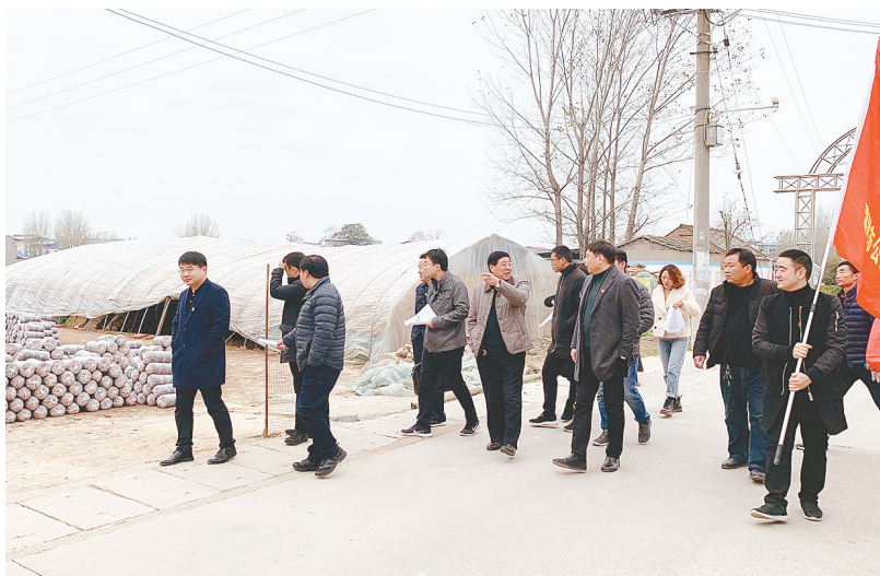
近日,市房投公司党员干部到万金镇郭庄村慰问困难群众,并向该村捐赠2万元的帮扶资金,用于村内基础设施建设。

针对武警官兵平时生活中所遇到的问题,市退役军人事务局还请专业律师为他们开展法律咨询服务。一位武警战士告诉记者,通过这次咨询,他不仅知道了遇到问题该如何解决,还学习到了不少相关的法律法规。