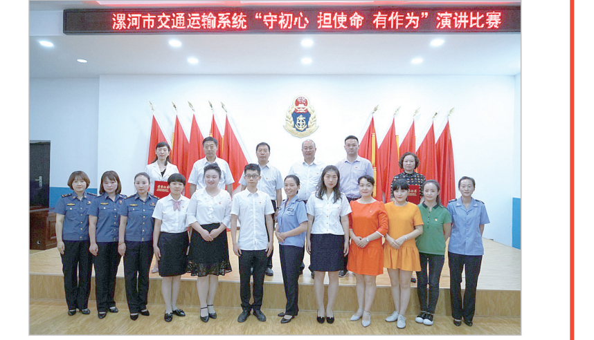
演讲比赛活动丰富干部职工文化生活。