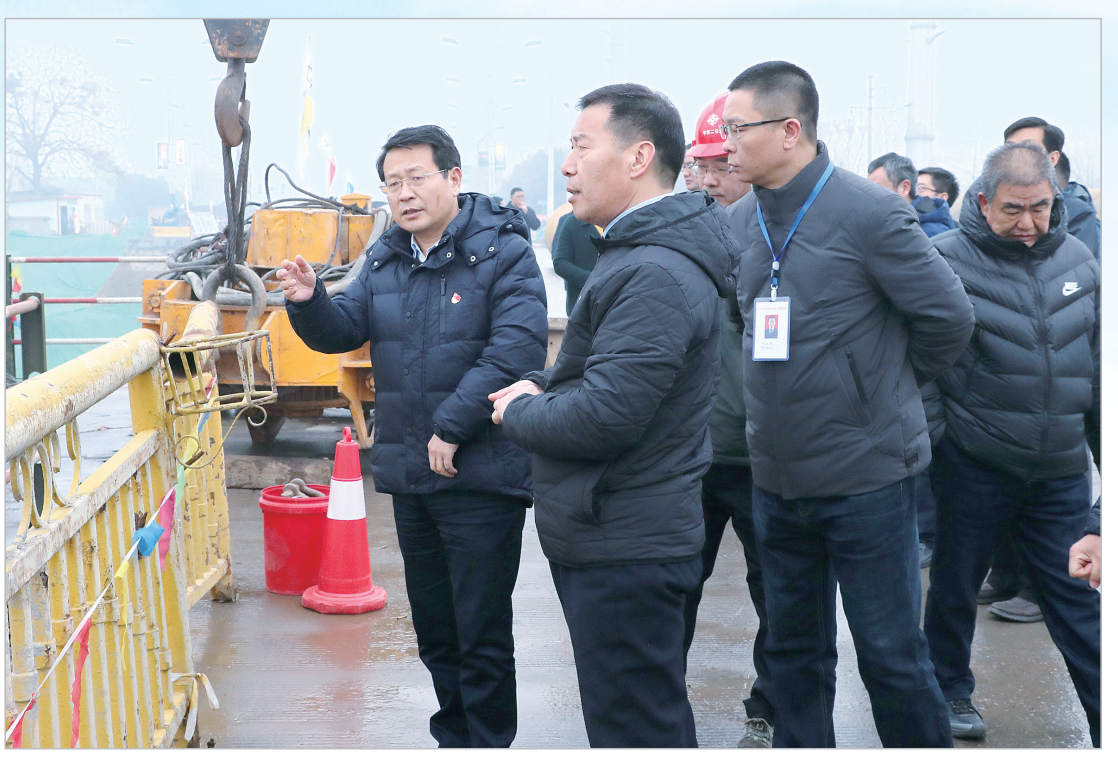
市委书记高慧杰在107国道沙河大桥察看工程建设情况。

认真落实“放管服”改革任务。根据法无授权不可为的思想,对行政许可、行政处罚、行政指导文书进行了规范,完善了权责清单动态管理机制,对保留的462项权责清单进行了动态调整,取消189项,保留273项;持续推进简政放权,按照“四统一”标准,对交通运输92项依申请权力事项进行重新录入,取消7项,保留85项。优化营商环境,定期对中介服务事项进行清理规范,共保留中介服务事项3项、证明事项5项。完成了市级非涉密投资项目审批事项集中进驻市行政服务中心的前期准备工作,涉及交通运输部门的工程设计变更审批、公路项目施工许可,交通基本建设项目施工图设计审批,特殊占用、挖掘、使用公路、公路用地行为审批,4项投资项目审批事项已按照要求完成系统录入,实现与市投资平台的顺利对接。加强交通执法监督,建立以信用承诺、信用公示为特点的新型监管机制,开展“双随机一公开”监督检查,重点对全市维修企业、物流运输业开展了随机执