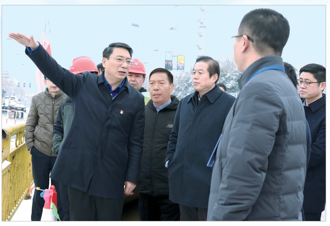
市委副书记、市长刘尚进带队察看百城建设提质工程和文明城市创建项目。

法检查,并及时公开了检查结果。突出抓好信用联合奖惩应用,组织开展了工程建设、道路运输领域信用评价工作,充分发挥公路建设市场、道路运输信用评价系统作用,实现信用评价考核全过程记录、信用信息实时归集,并根据信用评价结果建立信用分类监管制度,适时启动安全生产领域信用评价,实现交通运输行业重点领域信用评价全覆盖。