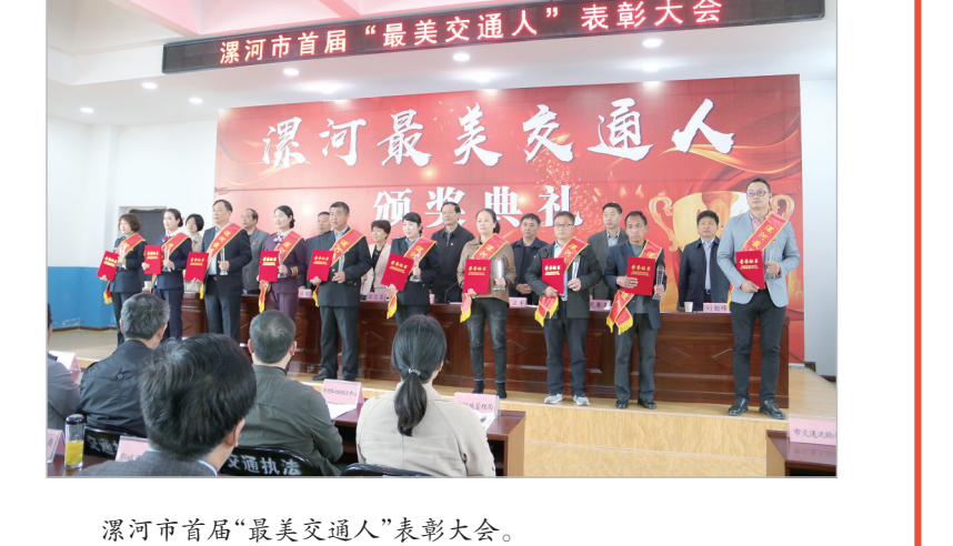
漯河市首届“最美交通人”表彰大会。