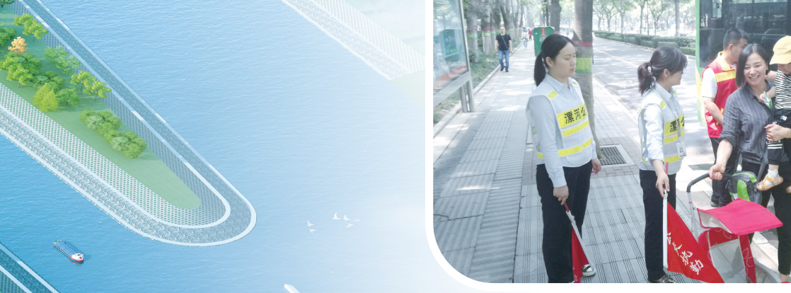
高速发展的城市公交方便了市民出行。

村均实现客货直通,圆满完成“万村通客车提质工程”目标任务。对G107京深线、S238常付线、S330道白线、S329郸石线四条公路近170公里持续开展路域环境提升活动。对平交口进行改造,统一硬化路缘示警带,规范设置公路沿线设施,统一设置标志、护栏、标线等;实行清扫保洁网格化管理,“全域无垃圾、车行无扬尘”成为常态。累计投入7972万元,全市干线公路优良路率达91.5%,持续领跑全省。