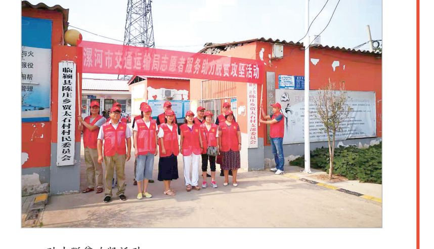
助力脱贫攻坚活动。