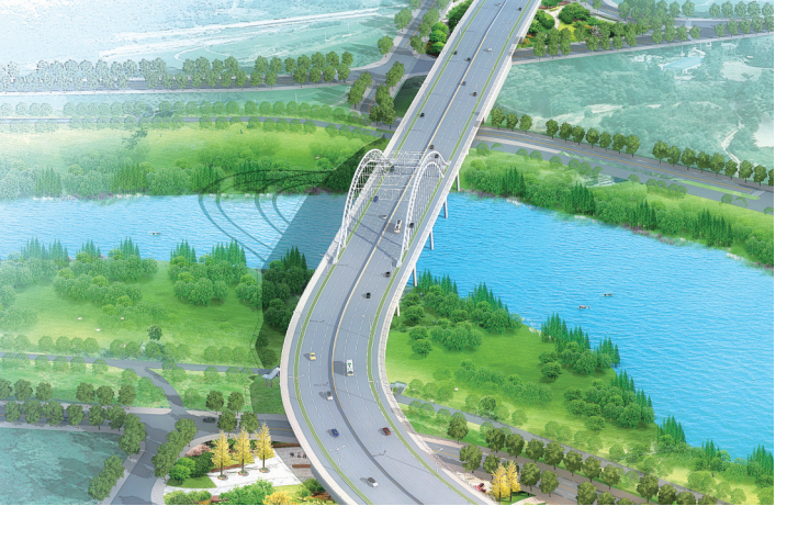
107国道沙河大桥及匝道工程。

航于一体的综合交通运输体系;立足乡村振兴战略,全面推进“四好农村路”建设,形成广覆盖的农村交通运输基础网络;立足交通运输结构调整,打造绿色高效的现代交通运输体系。主动担当作为,深入分析当前土地、资金等保障要素形势,“跑部进厅”争取支持,在许昌高速PPP项目、高速新开口、物流示范市创建、临港综合保税区建设、舞阳莲花镇通用航空机场建设等项目谋划中,为市政府提出决策预案。