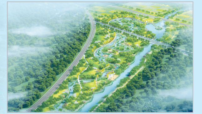
开发区青龙河生态湿地文化主题公园。