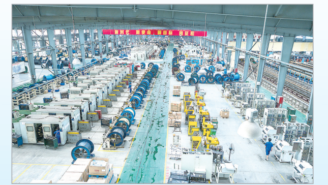
利通液压生产车间。