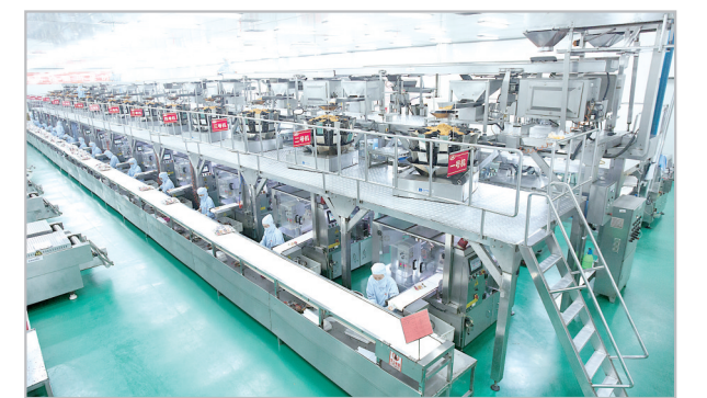
卫龙食品生产车间。

不惧风雨,只争朝夕。2020年是全面建成小康社会,实现第一个百年奋斗目标的收官之年,冲锋号已经吹响,开发区将紧紧抓住国家推进开发区创新提升、打造改革开放新高地这一历史机遇,以招商引资带动、精品园区打造、智慧城市建设、城投公司IPO上市、双包双带促双评、目标管理精细化和干部队伍双提升等七大载体为抓手,秉持敢为人先的开发区精神,用汗水浇灌收获,以实干笃定前行,奋力谱写新时代开发区出彩出彩的绚丽新篇章!