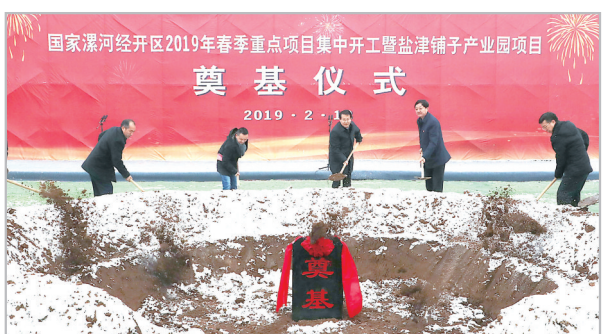
开发区2019年春季重点项目集中开工暨盐津铺子产业园项目奠基仪式。