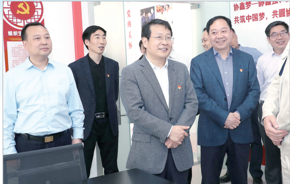
市委书记蒯慧杰在开发区调研。