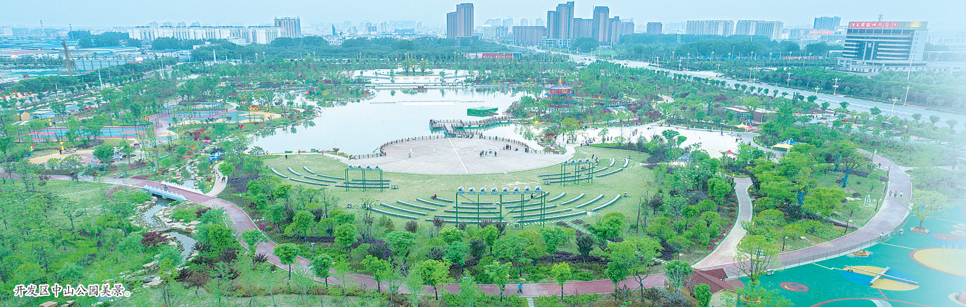
开发区中山公园美景。