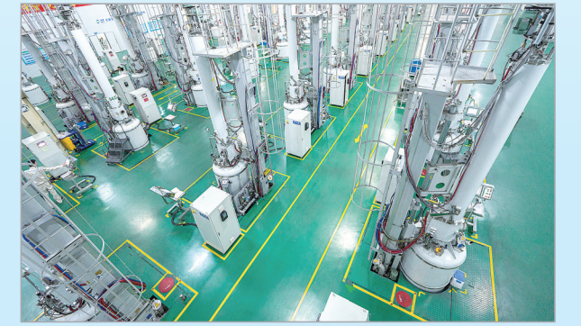
协鑫光伏生产车间。