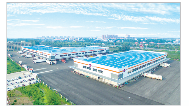
圆通(漯河)智慧物流产业园。