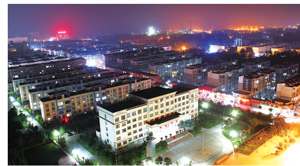
华灯初上的城区夜景

现重大突破,农村卫生室标准化建设实现全覆盖。新增城镇就业12849人,农村劳动力转移就业11169人,超额完成年度任务。不断提升群众安全感。全市率先建成县级综治中心,“雪亮工程”实现村庄主要出入口全覆盖;深化扫黑除恶专项斗争和“平安临颖”建设,扎实推进“转作风、强基层、扫黑除恶治乱逐村(社区)行”活动,群众安全感、执法满意度持续提升,连续三年被评为全省平安建设工作优秀县。