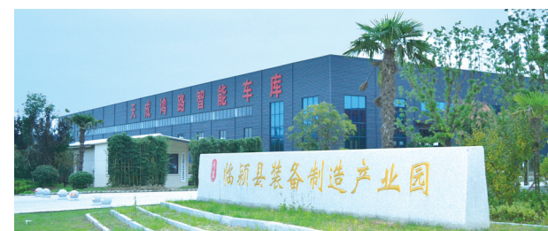
临颖县装备制造产业园