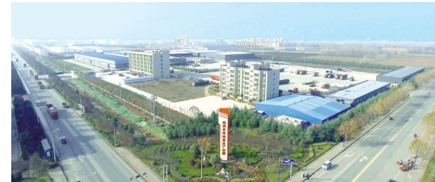
临颖县产业集聚区一角

强化要素保障。着力引进一批专业型、科技型、管理型人才;引导企业与周边职业院校合作建设实训基地,着力培养一批技术人才和产业工人。