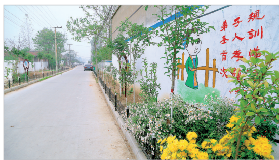
道路通了,环境美了,乡村越来越宜居