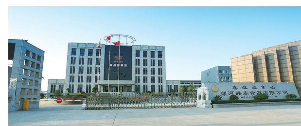
漯河联泰食品有限公司