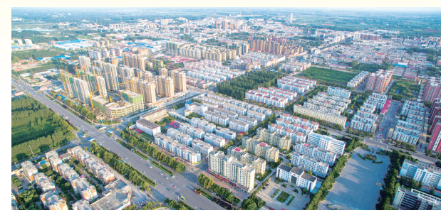
高楼林立的临颖新城

坚持发展惠民,共建共享,高标准完成6项20件省、市民生实事和10项46件县定民生实事。不断提升群众获得感、幸福感。城乡融合发展走在全省前列,社会办学实