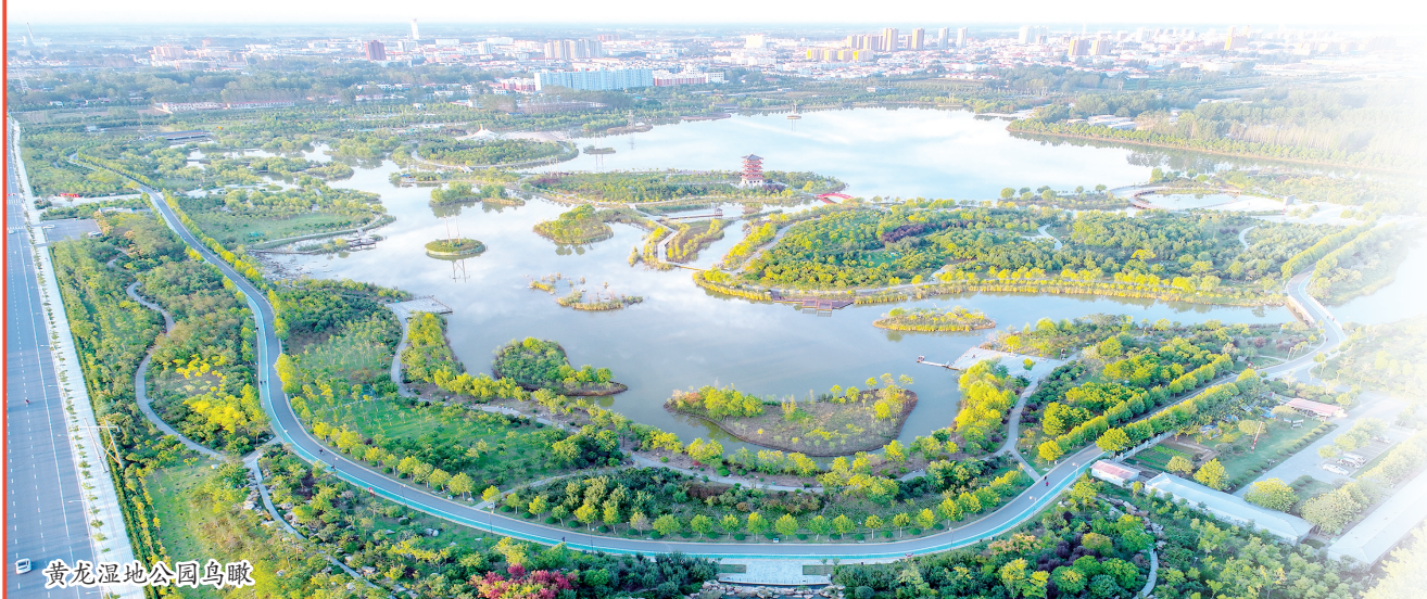
黄龙湿地公园鸟瞰