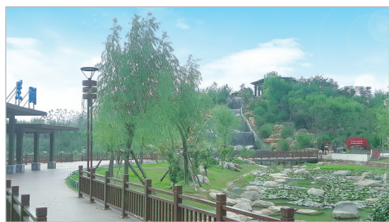
全省县级首家中水回用工程——兰湖公园