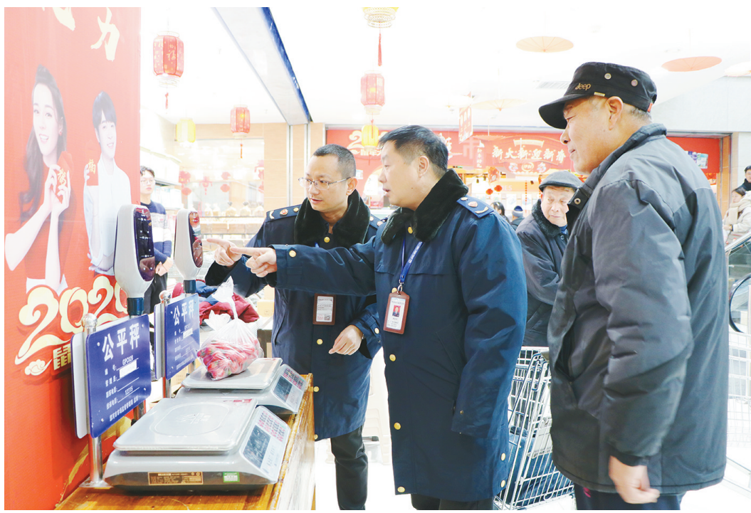
日前,市市场监管局组织执法人员,对全市大型超市、集贸市场进行计量监督检查,严厉打击“缺斤短两”等计量欺诈行为。图为该局郾城分局执法人员对市民购买的商品进行复秤检查。