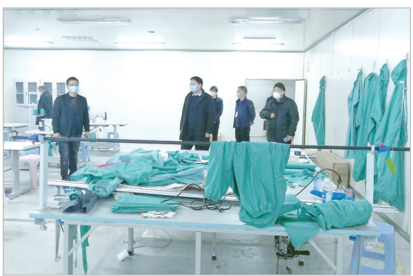
市金融工作局负责人到河南子任医疗科技有限公司调研企业资金需求。

全面动员,积极组织捐赠。截至2月26日,全市金融系统共捐赠现金200多万元,捐赠物资价值120多万元,并免费为全市公职人员、医疗工作者等提供新型冠状病毒肺炎专属保险,风险保障金额超过50亿元。2月19日,积极组织我市9家爱心企业向湖北省天门市捐赠了价值100万元的急需即食食品。