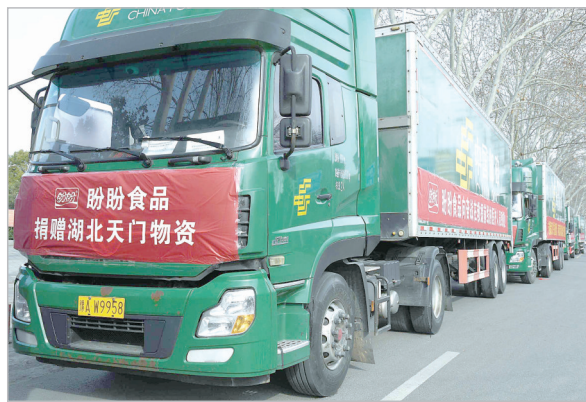
满载捐赠物资的车队整装待发,中国邮政集团漯河市分公司负责免费运输至湖北省天门市。

立特化工有限公司投放全市首笔小企业抗疫贷款200万元,用于企业生产84消毒液的原材料采购。同时,中国邮储银行漯河市分行临颍县支行积极对接临颍县百净卫生用品有限公司,在了解企业的特殊情况后,及时发放贷款,并且执行最大限度利率下浮,提供资金支持企业生产防疫物资。