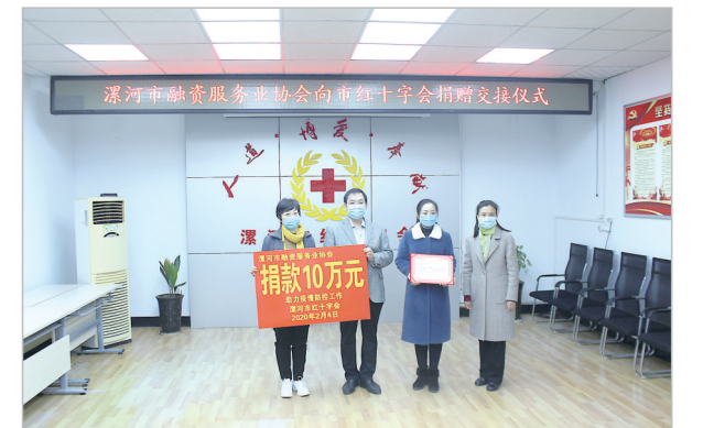
市融资服务业协会向市红十字会捐款10万元。

同时,中国平安财险漯河中心支公司免费赠送每份保额10万元的疾病守护金保险,供全市人民领取。截至2月16日,全市共计领取4168份。提供专属企业“复业保”保险,目前共计74家企业参与投保,减轻企业复工顾虑。中国平安财险漯河中心支公司积极响应银保监会号召,发挥科技优势,全面加强线上服务,通过“好车主”“好生活”APP客户端等线上服务平台,推出保单服务、理赔服务、用车服务等,确保客户便捷安全,全面助力疫情防控,助力疫后民营经济快速恢复。