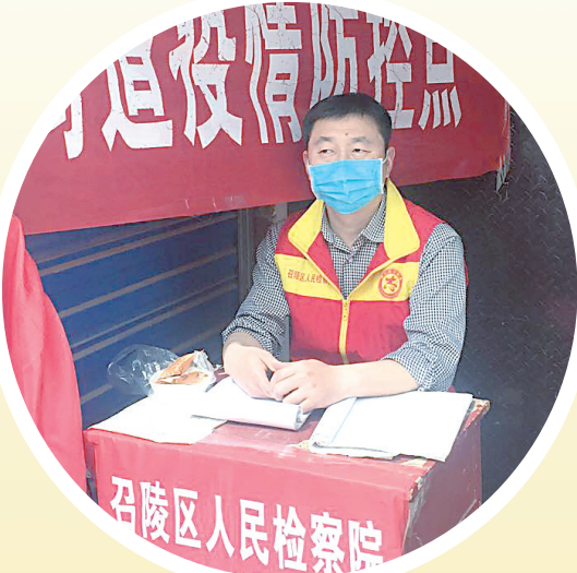
召陵区人民检察院志愿者参与居民小区疫情防控工作。