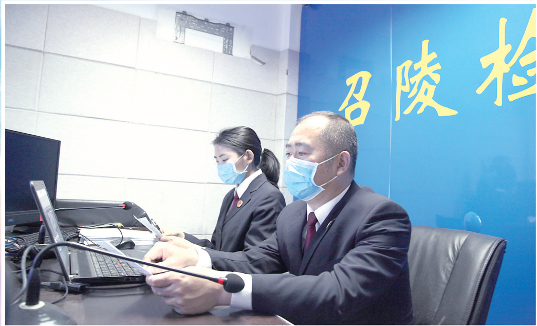
召陵区人民检察院党组书记、检察长曹伟“隔空”办案。

跨年之际,一场突如其来的疫情防控阻击战骤然打响,召陵区人民检察院严格落实上级关于疫情防控工作的指示和要求,有序开展疫情防控和检察办案工作,全体干警积极参加到疫情防控工作中,坚守岗位共战疫情,用实际行动践行着检察担当,让庄严的检徽始终闪耀在疫情防控与司法为民全过程。