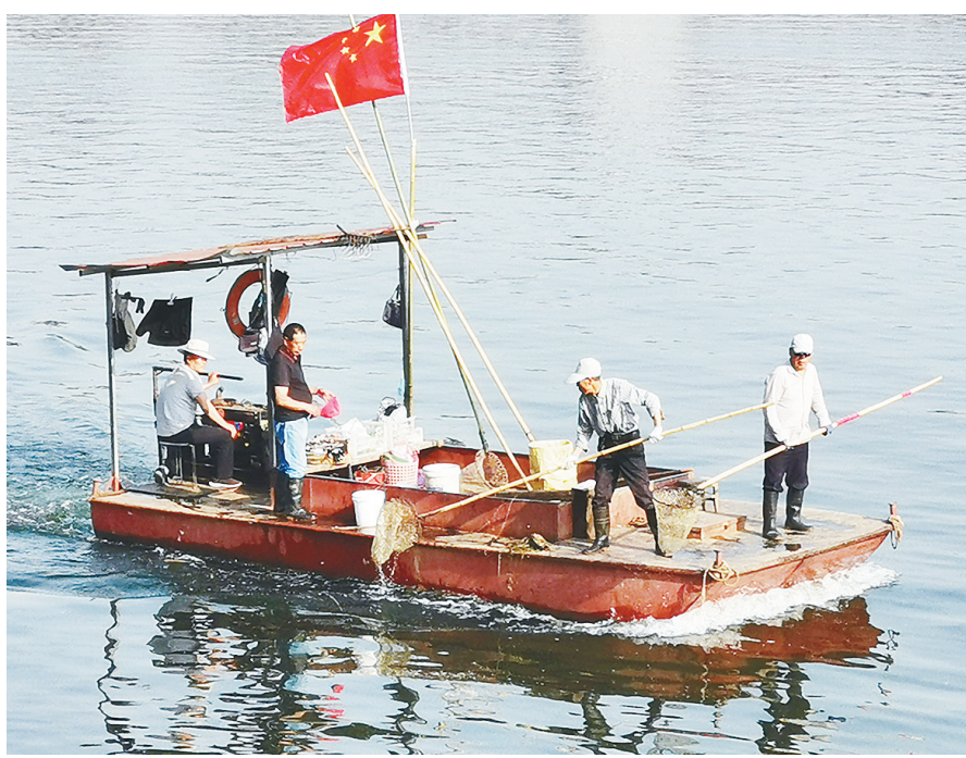
五月一日，沙澧河风景区工作人员正在河道内打捞垃圾。五一期间，景区工作人员对河道、岸边加大巡查力度，及时打捞垃圾，保障景区环境优美。