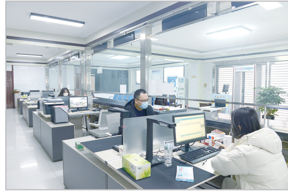
疫情期间，临颍县人民法院立案庭全体工作人员坚守岗位，提供网上立案、送达等线上诉讼服务。