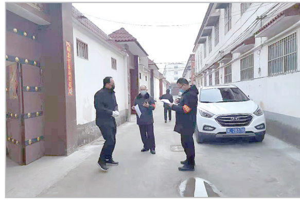
临颍县人民法院党员干部在分包小区排查、统计外地返乡人员信息。