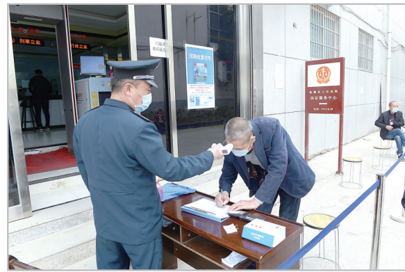
4月16日，临颍县人民法院诉讼服务中心有序恢复对外开放。