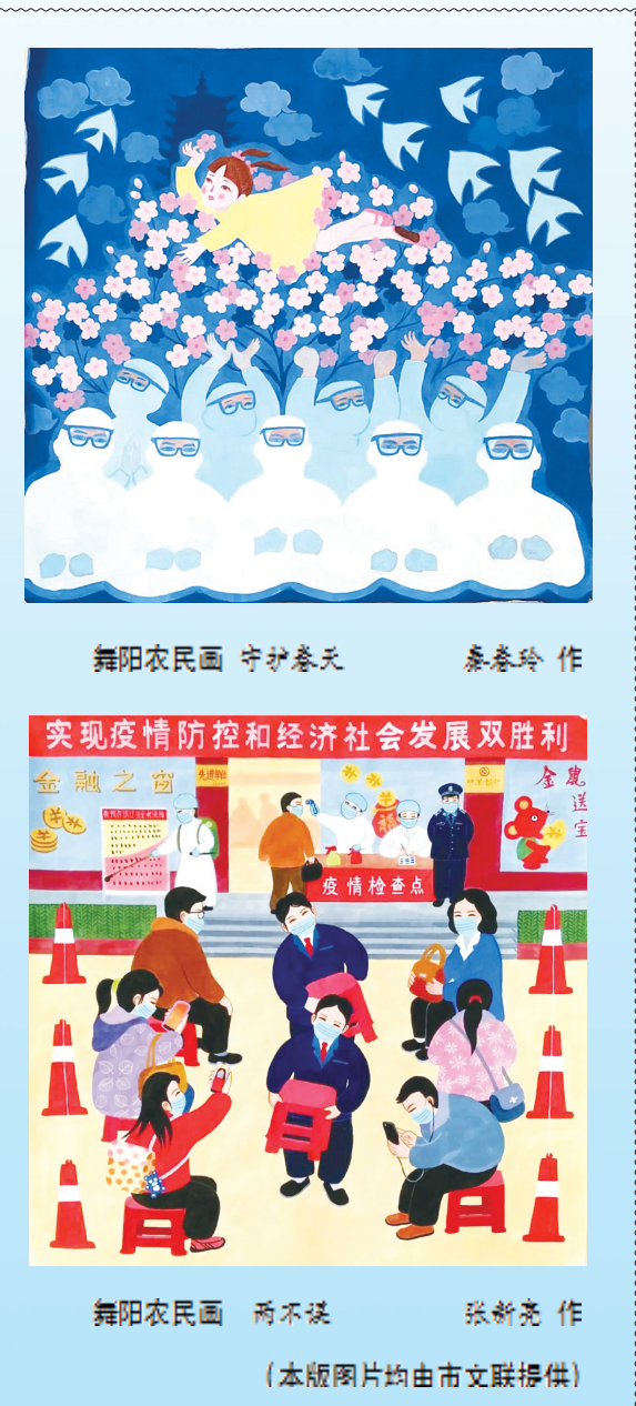
舞阳农民画 守护春天