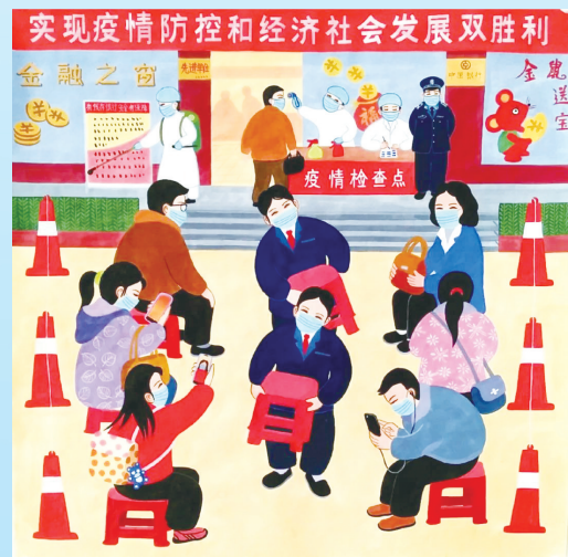
舞阳农民画 雨不误