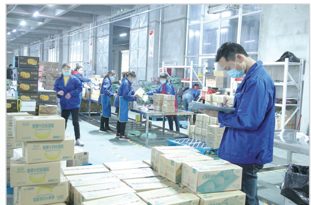
豪峰食品电商分拨中心工人正忙着发货