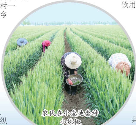
农民在小集镇套种小麦

临颍县抓住全省首批“百城建设提质工程”试点县机遇,深入实施“三城同创”和“五个临颍”建设,城区已建成32平方公里,常住人口25万人,城镇化率突破49%。畅通临颍方面,投资50多亿元,构建了城区“九纵十横”主干路网,实现了新城区和老城区、工业区和行政区互联互通、融合发展。水城临颍方面,投资2.58亿元,实施“颍水入城”,构建了覆盖县域面积一半的“两纵