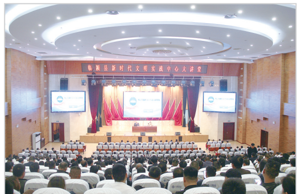
新时代文明实践中心大讲堂

境友好、集约高效,突出以亩均效益论英雄,强化招商引资“一号工程”,成功引进富士康康泰科技、盼盼食品、亲亲食品、养元饮品、台湾安全、台湾福尔、颐海海底捞食品等重大项目100余个,全县培育形成休闲食品、装备制造、现代家居3个百亿主导产业。推动企业升级。帮助113家企业实施“三大改造”项目142个,中大恒源创建全市唯一国家级绿色工厂,宏全包装成功申报河南省智能车间,产业集聚区创建省级绿色示范园区。坚持创新引领,建成院士和博士后科研工作站3个、省级工程技术研究中心11个,培育国家级高新技术企业16家。深入推进企业“倍增工程”,培育年销售收入超30亿元企业1家、超10亿元企业3家、超亿元企业20家。