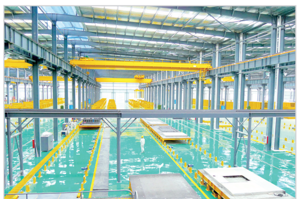
远大天成集团PC工业柔性流水生产线

强工业、促转型,加快建设千亿工业新城。做优发展载体。以23.72平方公里产业集聚区为主体,规划建设了9.9平方公里现代家居园区和9.8平方公里现代物流园区,构筑了43平方公里“一体两翼、三区联动”产业发展载体。产业集聚区6次被评为全省“十快”“十先”,升级为二星产业集聚区、省级经济技术开发区,2018年综合排序跃升全省12位;现代家居园区升级为省级产业集聚区,连续被评为中国“十大”木业产业园;现代物流园区升格为省级现代物流专业园区,临颍县成为全省为数不多、同时拥有三个省级园区的县。壮大产业集群。坚持产业绿色、环