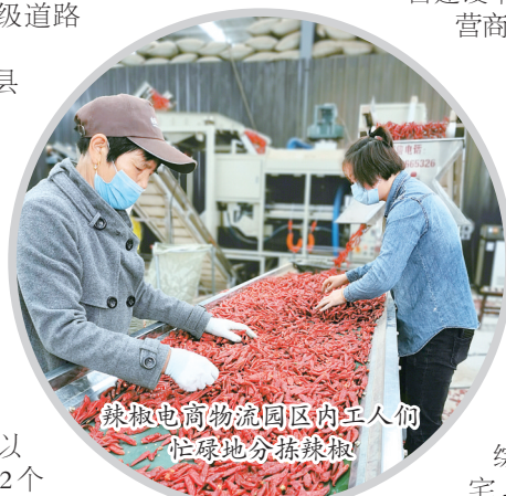
辣椒电商物流园区内工作人员忙碌地分拣辣椒

强统筹、促联通,推动城乡融合发展。立足工农互促、城乡互补,重点推动“五个融合发展”。规划融合方面,高标准编制完成临颍县城乡总体规划(2017~2035年),城区重点区域城市设计和道路系统、公共交通、教育空间布局等33项专项规划,