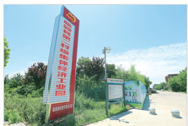
临颍县第二村级集体经济工业园