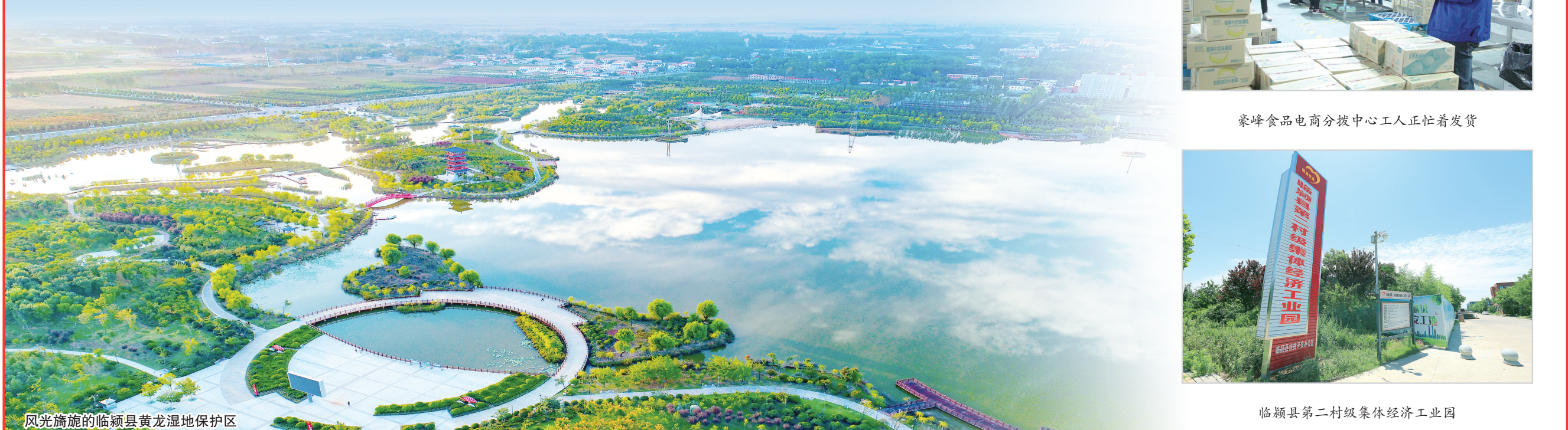
风光旖旎的临颍县黄龙湿地保护区