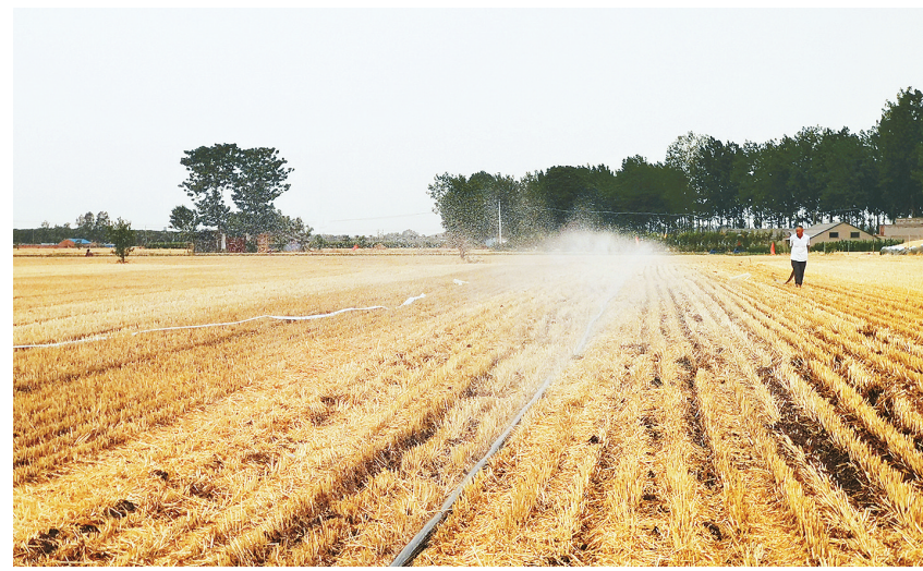
6月2日,市城乡一体化示范区姬石镇肖王村农民忙着给刚种下的玉米浇水。

质量工匠、中原大工匠、航空工业新航高级技师、航空工业首席技术专家、河南省总工会兼职副主席孟祥忠,全国劳动模范、全国五一劳动奖章获得者、中信重工重型装备厂数控一车间镗铣床大班班长刘新安,郑州市最美职工、圆方集团突击队队员、郑州圆方集团雪花母婴护理有限公司总经理助理海贝,河南省先进工作者、河南省五一劳动奖章获得者、漯河市临颍县公安局皇帝庙派出所指导员陈晓警分别作宣讲报告。