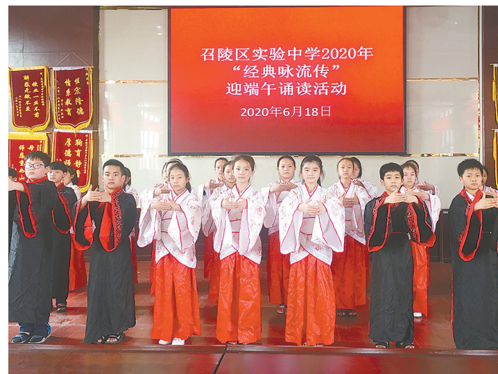
6月18日,召陵区实验中学小记者站组织小记者参加“经典咏流传”迎端午诵读活动。