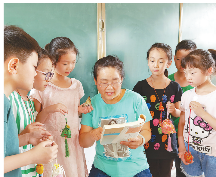
近日,召陵区人民路小学小记者站组织小记者参加“我们的节日·端午”征文活动。图为小记者们在聆听孙秋玲老师讲述端午节的由来。