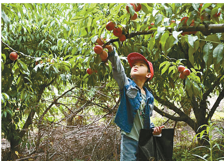
小记者们在桃园采摘桃子。

“参加本次活动,大家既是顾客又是销售员。大家在现场购买桃子的同时还在朋友圈帮别人