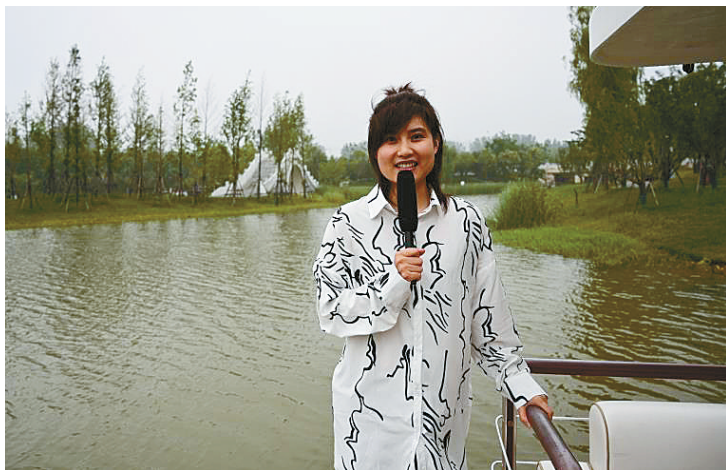
漯河日报社小记者部的老师在小南湖湿地公园直播。