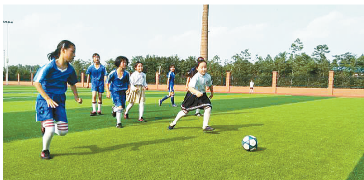
球场上,女队员在奋力拼搏。