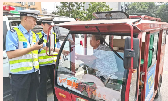
整治“摩的”不放松,创文攻坚在行动。