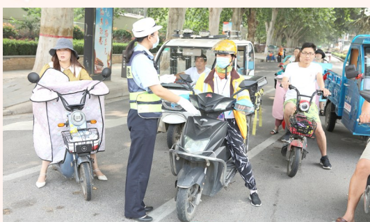
自觉遵守交通法规,争做文明市民。