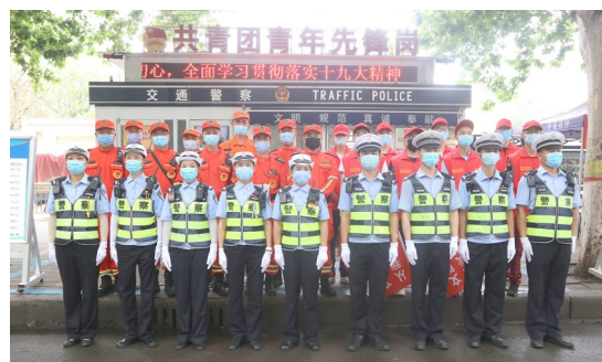
打响“四个战役” 决战创文攻坚。