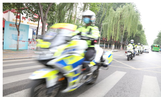
守护交通安全,倡导文明交通。