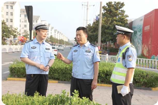
市公安局交通管理支队支队长袁坤亚(中)深入一线督导检查。