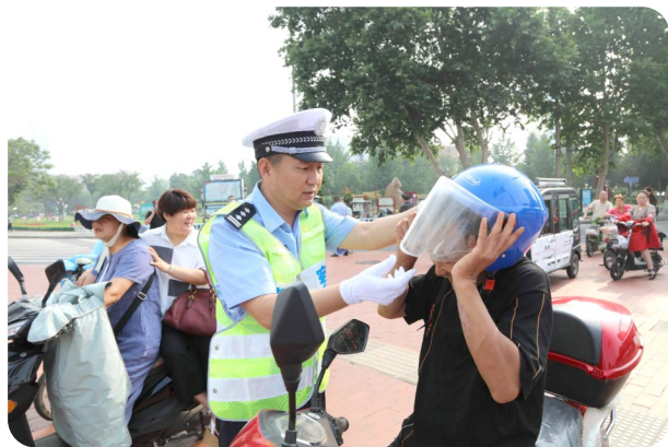
市公安局交通管理支队政委高东杰纠正不文明交通违法行为。