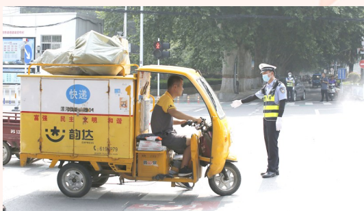
践行文明交通,创建文明城市。