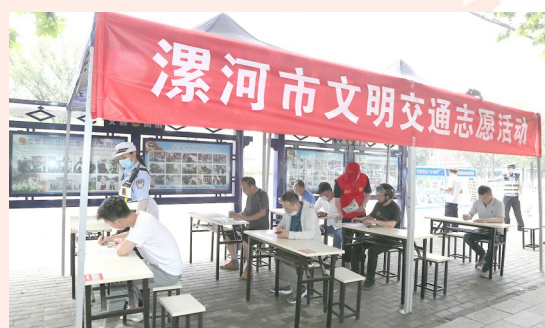
尊法守规明礼,安全文明出行。