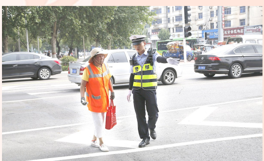
做一名文明交通的践行者。