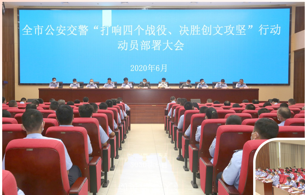
全市公安交警“打响‘四个战役’、决胜创文攻坚”行动动员部署会现场。

为加强市区道路交通管理,营造安全、有序、畅通的道路交通环境,进一步推进我市全国文明城市创建工作,6月29日,全市公安交警“打响‘四个战役’、决胜创文攻坚”行动动员部署会召开,对专项行动作了部署,决定自7月1日至12月31日,在全市范围内组织开展“打响‘四个战役’、决胜创文攻坚”行动,通过打响“四个战役”(交通秩序整治提升战、交通设施完善提升战、文明交通宣传提升战、执法形象规范提升战),强力助推全国文明城市创建工作。