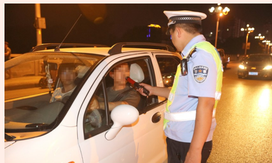
拒绝酒驾、醉驾,践行文明交通。

7月1日至7月5日,全市公安交警部门共查处各类交通违法行为7000多起。其中,机动车不主动礼让斑马线278起;违反“一盔一带”交通违法986起;机动车闯红灯、车窗抛物、随意变道、乱鸣笛等125起;行人、非机动车交通违法3329起;暂扣“摩的”59辆,查处酒驾(醉驾)38起。执法点集中教育学习2358人次。