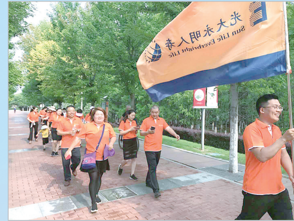
光大永明人寿漯河中心支公司组织员工开展户外健身活动。