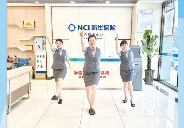
新华人寿保险漯河中心支公司员工表演健身操。