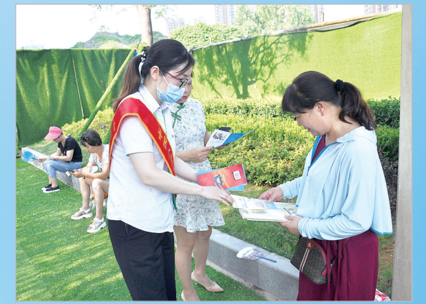
中国人寿财险漯河市中心支公司工作人员到社区宣传保险知识。