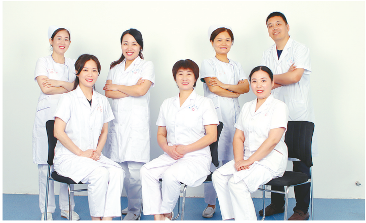
市三院(市妇幼保健院)生殖遗传科团队。