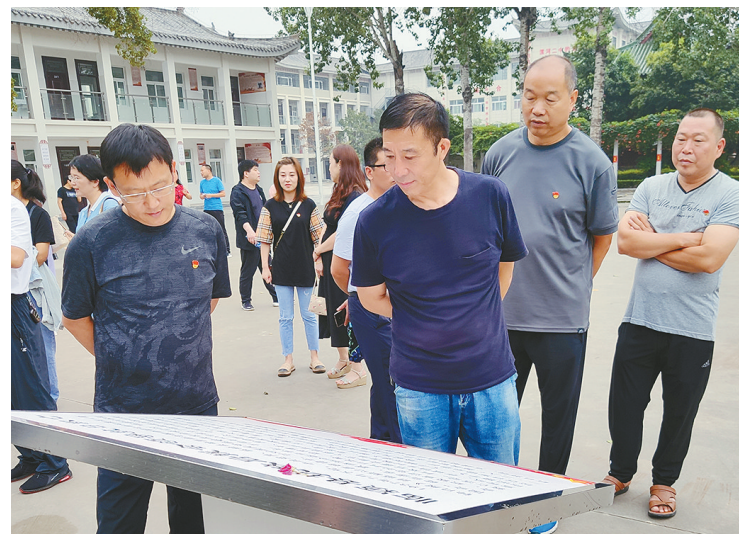
7月14日，漯河实验高中组织党员到漯河二中红色教育基地，开展“牢记初心使命，争当出彩先锋”主题活动。