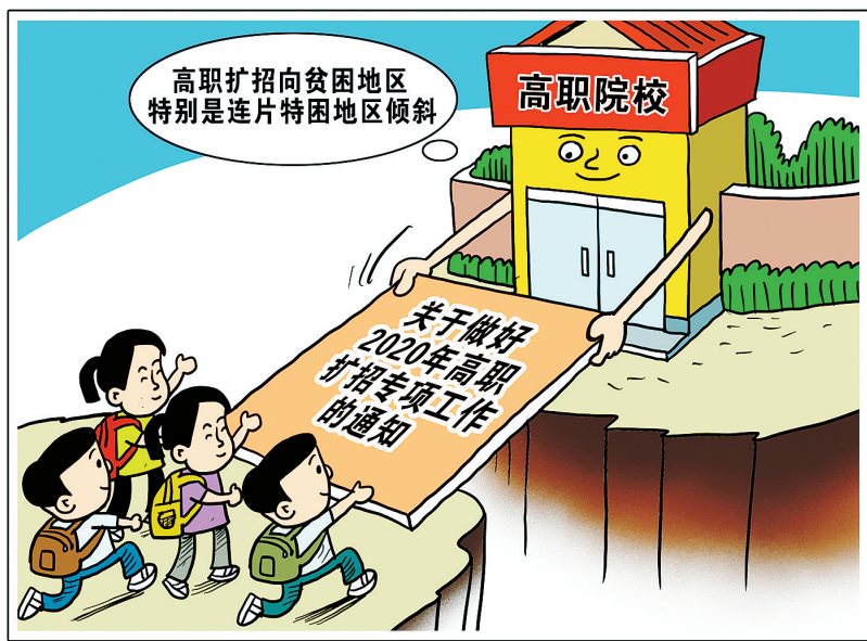
日前，教育部、国家发展改革委等六部门联合下发《关于做好2020年高职扩招专项工作的通知》，要求各地全面深化职业教育改革，进一步稳定高职扩招规模，确保稳定有序、高质量完成2020年高职扩招专项工作。