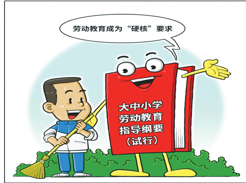
为落实《中共中央 国务院关于全面加强新时代大中小学劳动教育的意见》，加快构建德智体美劳全面培养的教育体系，近日，教育部印发《大中小学劳动教育指导纲要（试行）》，明确劳动教育目标框架及大中小学劳动教育主要内容和具体要求等。