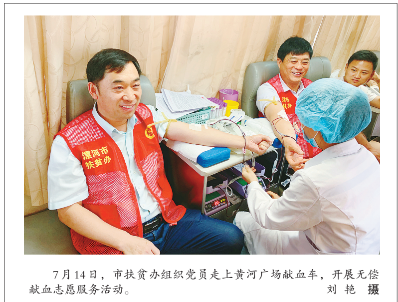
7月14日,市扶贫办组织党员走上黄广广场献血车,开展无偿献血志愿服务活动。刘艳 摄

该院负责人介绍,活动中如果发现违规人员将严肃处理,追回违规所收资金并双倍罚款甚至开除违规人员。同时,患者或市民如果发现医院内有医保欺诈骗保行为,可以向基金安全”倡议书,并通过图片展板、专家解答等方式,向参会人员普及医保知识,对医保政策