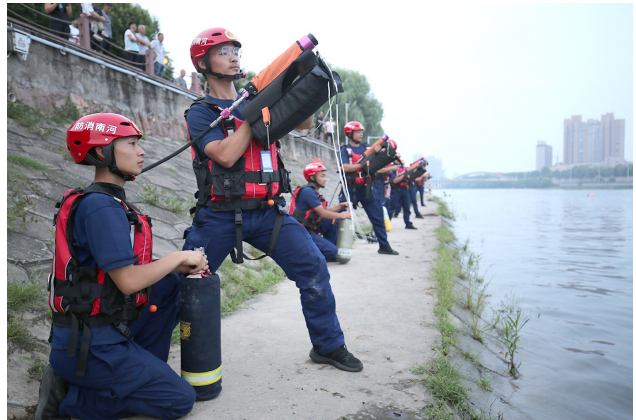
救生抛投器岸上救人操(训)练