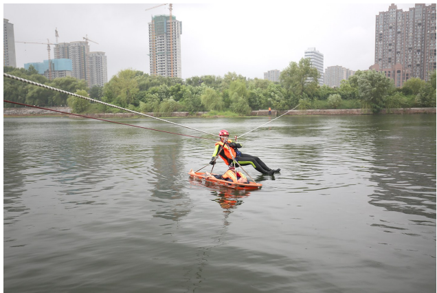
T型绳索孤岛救生训练