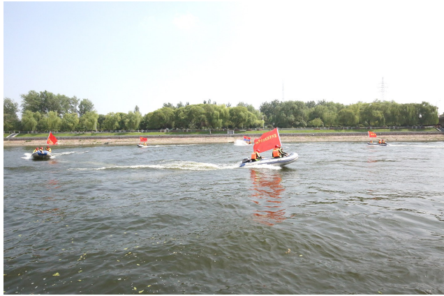
水域救生人员搜索编队训练

当前，我市防汛已进入“七下八上”的关键时期。面对防汛抗洪救灾异常严峻的形势，全市消防救援支队指战员发扬连续作战、不怕苦、不怕累精神，刻苦训练，紧密备战，确保做到召之即来，来之能战，战之能胜。消防队员纷纷表示，无论洪水有多大，无论遇到多大的险情，他们都会坚守使命担当，坚决做到“两个维护”，面对生与死的严峻考验，不畏艰险、逆向而行，以实际行动诠释“人民至上、生命至上”，书写对党和人民的无限忠诚。