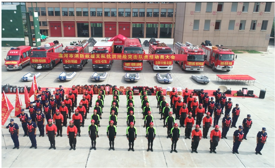
漯河市消防救援支队抗洪抢险救灾突击队整装集结

暴雨不止，洪水肆虐。近段时间，江西、湖北、重庆、湖南等地遭遇强降雨引发的洪灾。洪水围住城市、席卷农田，群众受灾、损失惨重……雨带北移，主汛期至，我市防汛抢险形势异常严峻。