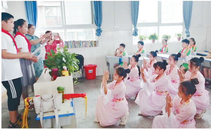
近日，许洼小学举行期末书香成果展示。图为学生在班级内进行诗词诵读、表演。

出示“健康码”并测温登记。设立贷款办理咨询台，公开咨询电话，耐心解答学生及家长的疑问。对前来办理助学贷款的学生及其共同借款人的资格认真审查，使符合条件的学生都能享受到助学贷款。此项工作将持续到9月份。 潘范学 刘宇 朱晓燕