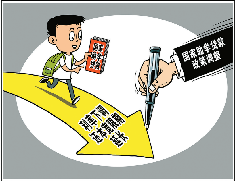
调整完善国家助学贷款有关政策