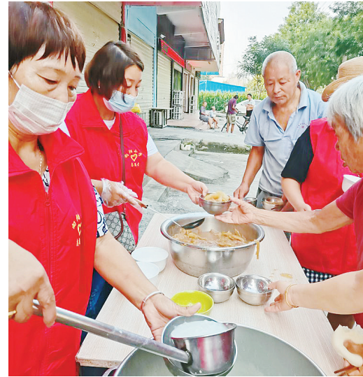
八月十一日，郾城区向阳小学组织志愿者到沙北街道邱山路的爱心粥棚开展志愿服务。