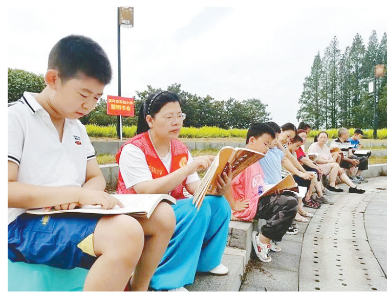
8月7日,市实验小学党员教师在红枫广场组织学生开展暑假诵读活动。

郭爱兵说:“高考是我发挥得最好的一次。我一直有个梦,想考第一名。但学校里优秀的人实在太多了,幸好我从未放弃。在压力与动力并存的高三,在一点一滴的努力下,我实现了梦想。”