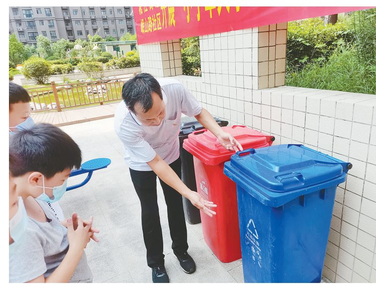
8月11日,郾城区许洼小学的党员教师到崾山路社区开展公益活动,为孩子们讲解垃圾分类知识。