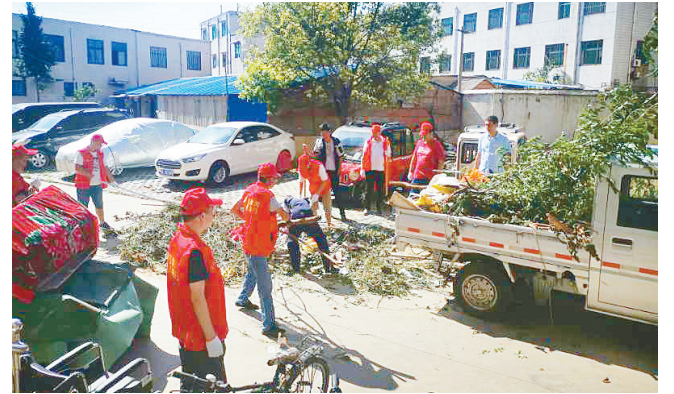
8月15日上午,市房投公司党支部组织全体党员到朱庄社区开展志愿者服务活动,并发放漯河文明条例宣传单500余份、“三问于民”问卷调查200余份。图为帮助小区居民清理院内杂物。

此次活动具体评选条件和要求在“漯河工程造价信息网”及工程造价微信平台发布,各参选企业可在9月7日前将申报材料提交到定站相关负责科室。对评出的优秀工程造价成果,主办方将予以表彰,并推荐参加河南省优秀工程造价成果评选活动。