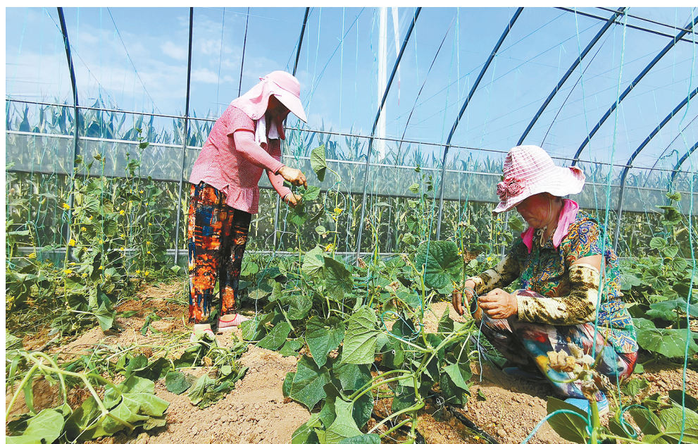
刘庄村村民正在大棚里干活。

■本报记者 张晨阳 在舞阳县辛安镇刘庄村,一座座白色的大棚并排建在农田里,大棚里的黄瓜长势良好。忙碌的人们一边干活,一边唠家常。提起村里的好政策,大家都赞不绝口:“大伙儿在这里干活离家近,也不累,一天能挣60块钱,还管饭。逢年过节,村里还给我们送鱼送肉……” 原来的刘庄村,因地理位置偏僻,村内基础设施较差,经济发展相对滞后,是省级贫困村。为改变这样的状况,张士兴自担任村支部书记以来,千方百计引领群众发展经济,出主意,想办法,多渠道增加群众收入。为了充实村里的经济,张士兴把自己经营十多年、价值100多万元的砖厂捐给