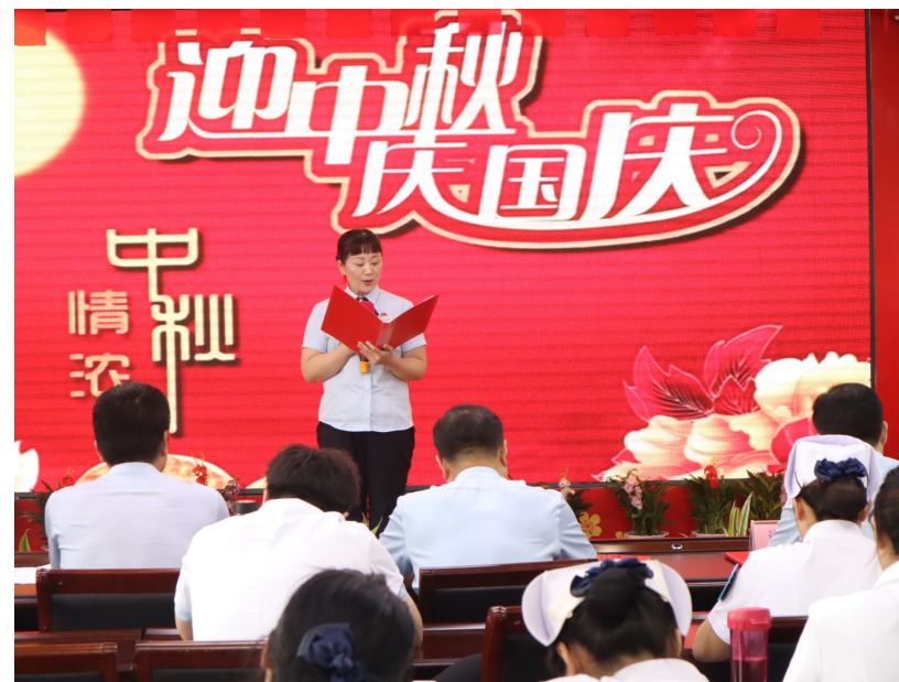
9月29日,漯河柳江医院组织全院医护人员开展以“月圆中秋,抒发爱国情怀”为主题的朗诵比赛。