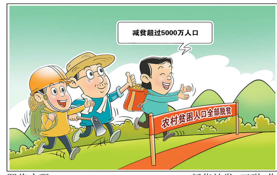
即将实现 新华社发 王琪 作

结构进一步优化,自主脱贫能力稳步提高。贫困人口主要通过务工和生产劳动实现脱贫,劳动收入占比逐年提升,非劳动收入占比逐年下降,增收可持续性稳步提高。