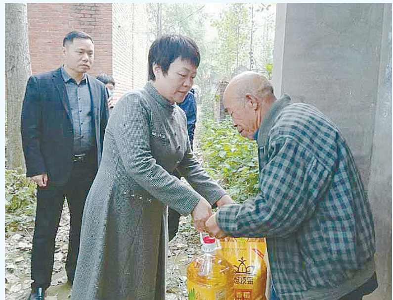
10月17日,中国人寿财险漯河市中心支公司工作人员到召陵区邓襄镇柏子村开展扶贫捐赠,为该村捐赠空调、米、面、油等价值6000元的物资和5000元的慰问金。

需求情况,并结合农信社金融产品,向贫困户讲解扶贫贷款办理流程;五是注重宣传实效,精心选取贫困户通过扶贫贷款实现脱贫的先进事例和先进经验,让贫困群众通过身边人、身边事增进对扶贫政策的了解,树立脱贫信心。 王景雷