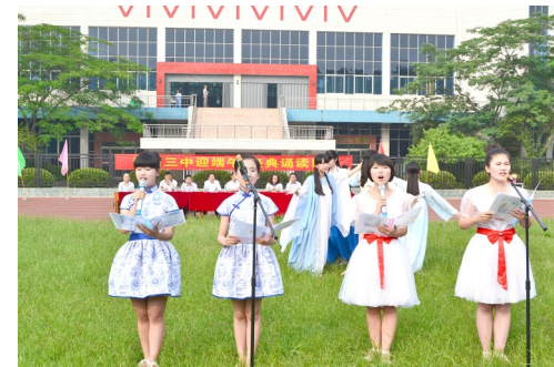
迎端午经典诵读比赛