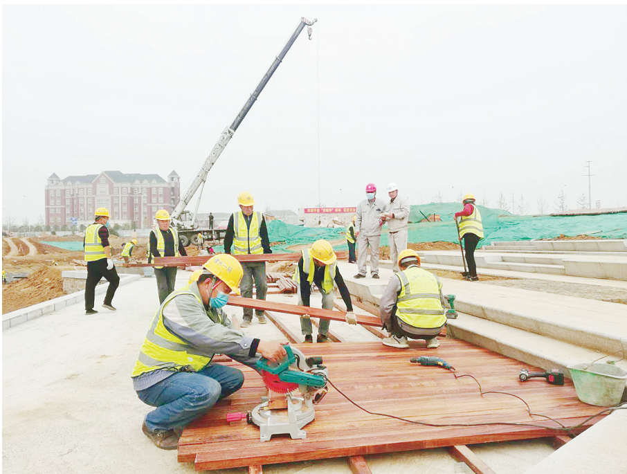
10月27日，工人们在加工木铺装面板。西城区水生态综合治理项目按照豫水一局“安康杯”竞赛活动要求，积极开展各类安全生产活动，有效减少和杜绝了各类事故的发生。