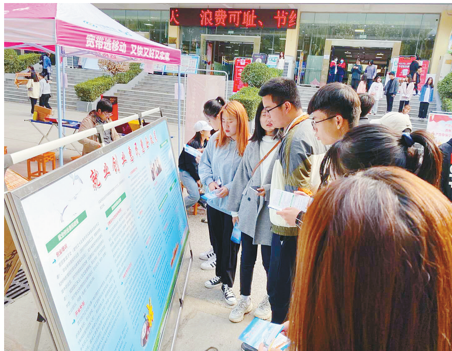
近日，市劳动就业指导服务中心组织开展了“就业创业惠民政策进高校”专题宣传活动，对我市就业惠民政策进行宣传，鼓励高校学子创新创业。图为在漯河医专的宣传场面。