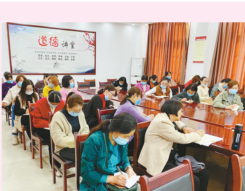
10月24日，柳江路小学以“成就孩子一生的语言力量”为主题，组织全校家委会成员开展家风教育公益课堂。

一个人走路能走很快，一群人走路能走很远。在名师工作室，教师们互相提醒，互相鼓励，互相学习，工作热情更高了，教育質量更高了。“我们希望以名师工作室为载体，促进中青年教師专业成长，打造一支在漯河教育领域中有成就、有影响的高层次教师团队。”数学名师工作室主持人彭战中说。