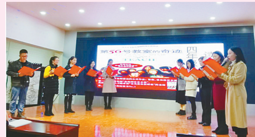
近日，西南街小学组织教师举行读书交流会。