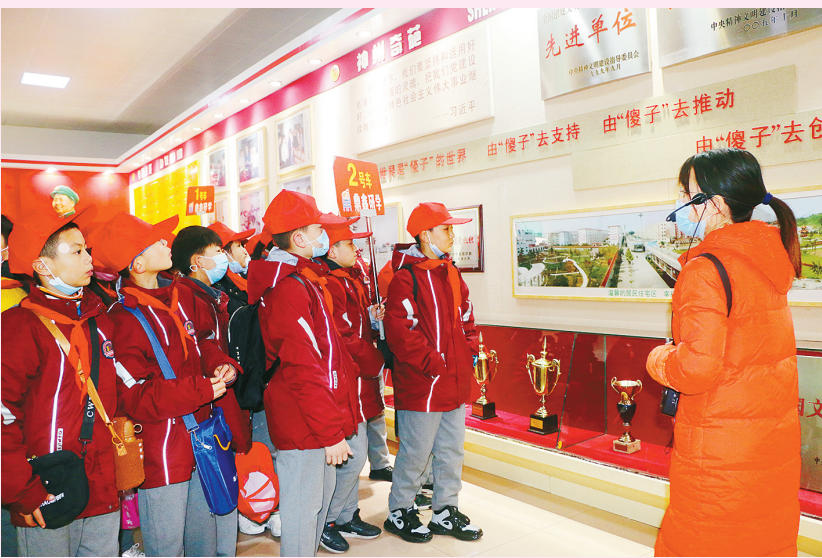
近日，召陵区实验小学组织师生到临颖南街村开展“踏寻红色足迹 学习科普知识”研学旅行活动。