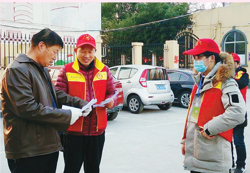
近日，漯河三中组织教师志愿者到分包社区开展“大宣传、大走访、大化解、大防控”宣传活动。