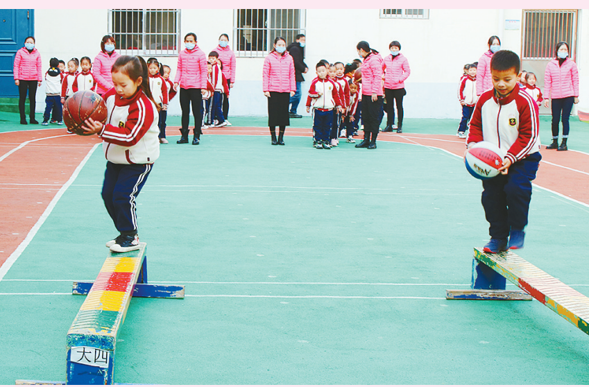
近日，郾城区实验幼儿园开展以“约冬季 悦运动 越健康”为主题的冬季运动会。