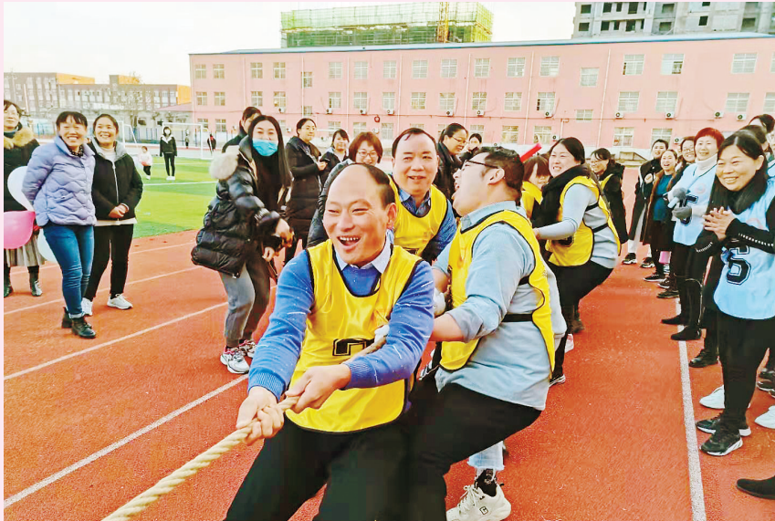
12月11日，临颖县黄龙学校举行教职工运动会。