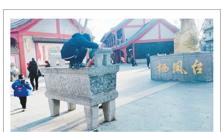
1月1日,在开源河上街景区,一名儿童攀爬设施。

声明 漯河日报社所属媒体对发布的原创新闻信息拥有合法版权,未明确书面许可,严禁复制、转载或引用,违者将依法追究法律责任。