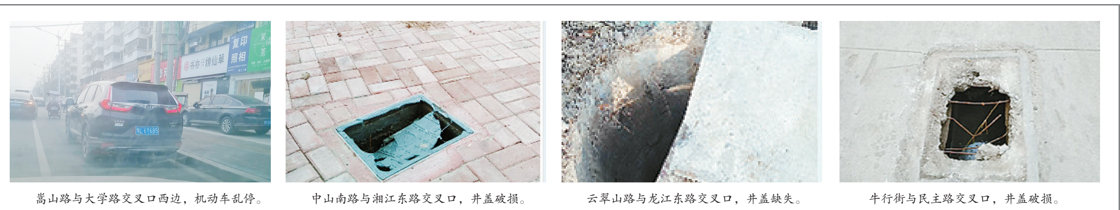
嵩山路与大学路交叉口西边,机动车乱停。