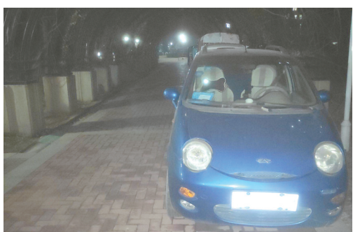
天鑫现代城小区,机动车占用消防通道。