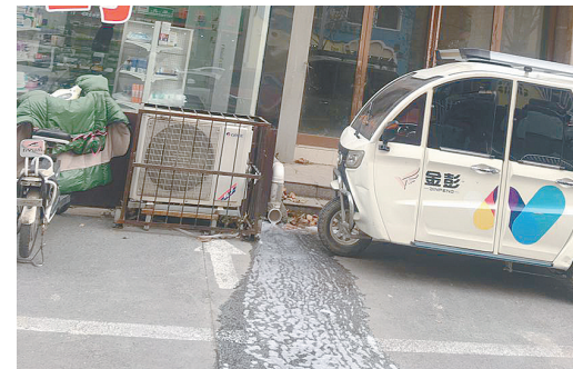
嫩江路东段一药店门前,污水横流。