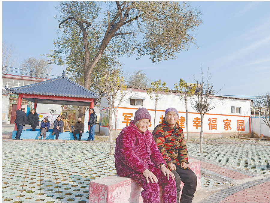
村民们在村里的广场游园休闲聊天。

如今,整洁的乡村道路贯通全村,公园式的文化广场平坦开阔,白墙灰瓦的庭院错落有致,现代化的公厕沿街而立。随