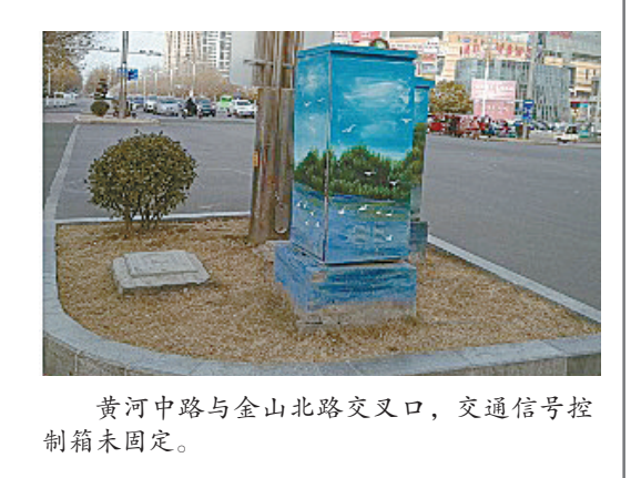
黄河中路与金山北路交叉口,交通信号控制箱未固定。