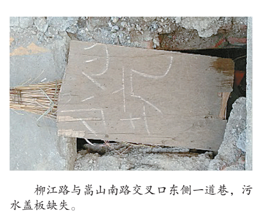
柳江路与嵩山南路交叉口东侧一小巷,污水盖板缺失。