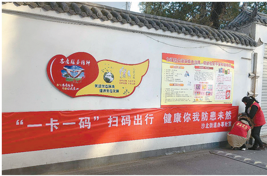
1月13日,沙北街道嵩山社区工作人员在辖区各小区和醒目位置悬挂疫情防控知识相关横幅,提高居民防控意识。

网友“攀枝燕”:架子车上的车圈子让我的记忆一下子回到那个年代。时光太快,好在生活越来越好。