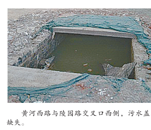
黄河西路与陵园路交叉口西侧,污水盖板缺失。