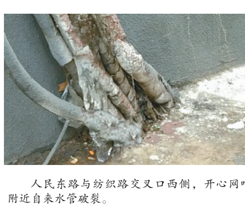
人民东路与纺织路交叉口西侧,开心网吧附近自来水管破裂。