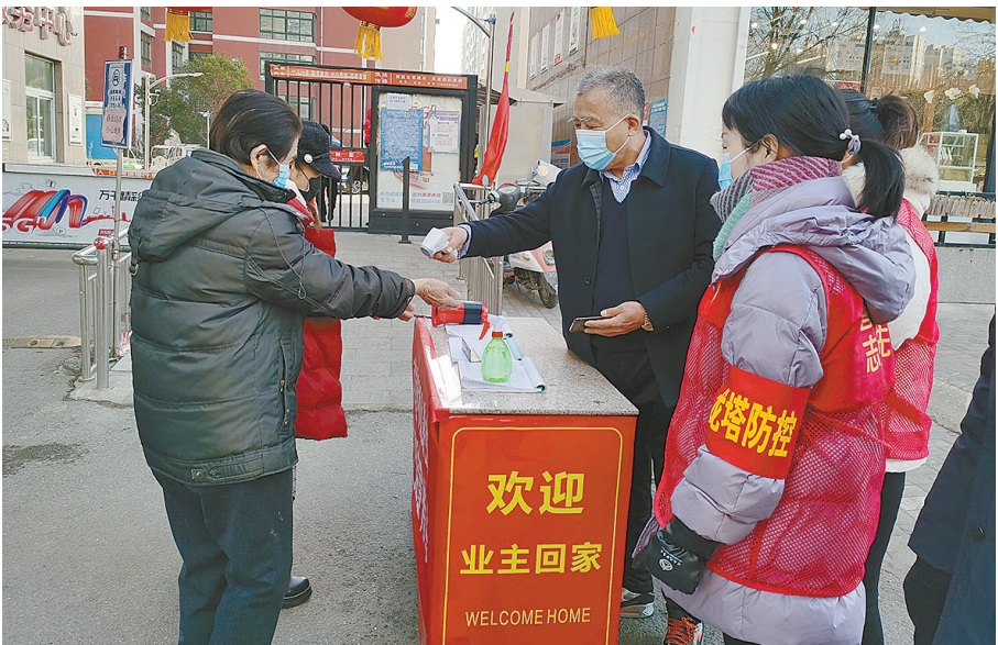
1月13日上午,龙塔街道祁山路社区亚泰名仕公馆小区门口,社区工作人员为进入小区的业主测量体温,并提醒业主戴好口罩。