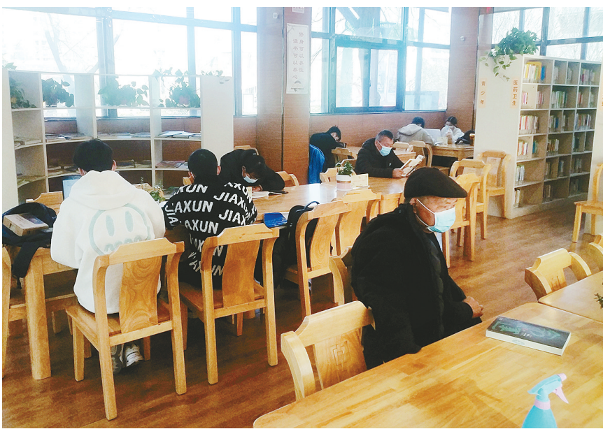
市民在位于双汇广场的城市书房读书学习。