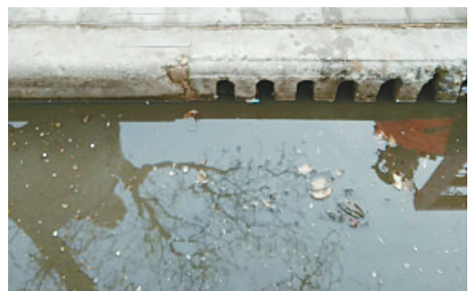
泰山北路与海河路交叉口附近，下水道堵塞。