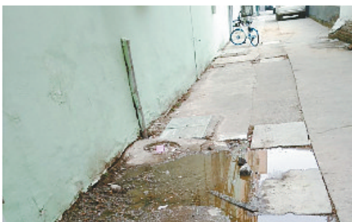
辽河路与交通北路交叉口附近，下水道堵塞。