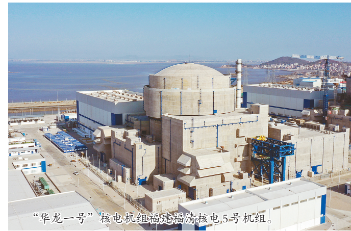
“华龙一号”核电机组福建福清核电5号机组。

中核集团1月30日宣布,全球第一台“华龙一号”核电机组福建福清核电5号机组已完成满功率连续运行考核。