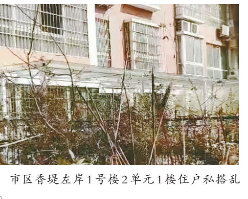
市区香堤左岸1号楼2单元1楼住户私搭乱建。