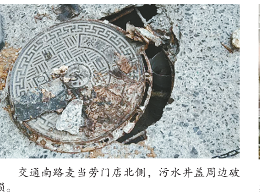
交通南路麦当劳店北侧,污水井盖周边破损。