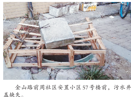
金山路前周社区安置小区57号楼前,污水井盖缺失。