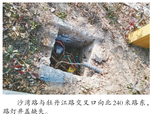
沙湾路与牡丹江路交叉口向北240米路东,路灯井盖缺失。