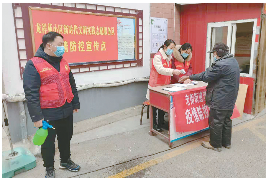
龙祥苑小区新时代文明实践点的志愿者对进入小区居民测量体温、登记信息。

社区是落实联防联控、群防群控的关键。广泛开展疫情防控志愿服务是近期志愿服务的主要内容之一。全市志愿者常态化开展疫情防控志愿服务,积极参与社区、农村疫情防控工作,全面开展防疫宣