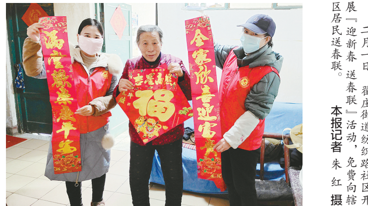
二月一日,翟庄街道纺织路社区开展“迎新春送春联”活动,免费向辖区居民送春联。

郾城区文化馆相关负责人介绍,本次演出既是“唱响村戏、同绘村画、共享‘村晚’”公共文化志愿服务活动,也是孔沈邓村第五届“村晚”演出。由于疫情防控需要晚会改为直播,但节目质量没有降低,文化馆还派出专业人员进行指导。这场晚会将在春节期间在网络上播放。