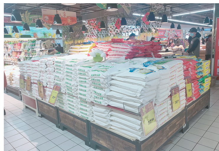
黄河路丹尼斯超市货物供应充足。