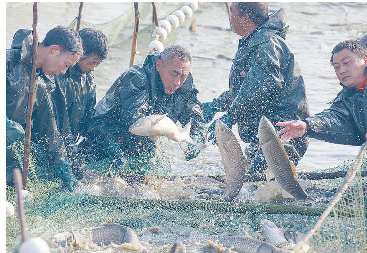
春节临近,活鱼在集市很受欢迎。2月3日上午,源汇区问乡一养鱼场正在冬捕,供应节日市场。

聚力弘扬文明新风。该镇契合春节主题,张贴文明主题对联,悬挂社会主义核心价值观主题灯笼。创新载体,广泛开展志愿服务活动,大力宣传社会主义核心价值观,强化为民服务意识。利用时代广场大型电子显示屏,展示我市文明创建成果成效,唱响文明向上主旋律。该镇还依托新时代文明实践所,弘扬传统文化,倡树文明新风,营造健康向上、文明和谐的节日氛围。