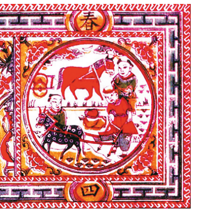
清代山东高密年画《春夏秋冬》之“春”图。

首？阴阳家认为，春属“木”，夏属“火”，秋属“金”，冬属“水”，“土”生万物。古人又将春、夏、秋、冬与东、南、西、北相配，《史记·天官书》称“东方木，主春”，相应地，“春”与“东”相配后，生机勃勃的春季，自然就成了“四时之首”。 关于“东方”与“春”的哲学关系，日本汉学伏见氏撰《尚书大传》：“东方者何也？物之动也。物之动何以谓之春？春出也物之出也，故谓东方春也。”而古人将二十四节气中的第一个节气称为“立春”，也在“物之动也”的说法里。所谓“立”，建立的意思，引申为开始；“春”呢，《尚书大传》称：“春，蠢也，物蠢生，乃动运。”所谓“立春”就是到了生物蠢蠢欲动的时候。 秦汉人崇东方，当时的宫殿和在考古中发现的这一时期墓葬几乎全部“面东”，故对四季中的“春”也推崇万分：“春者，天地开辟之端”，民间更有“春朝(立春)大于岁朝(正月初一)”之说。因为对“春”格外重视，古人视立春为“岁始”，过“岁节”往往比过“年节”的声势还大。从周代到清末，都以“立春”为一岁的大典，民间有“立春大过年”的谚语。古人对何时立春、阴历年有无立春都特别在意，立春节气还有“迎春礼”“祀春神”“进春山”“鞭春牛”“咬春饼”“戴春花”“占春兆”等一系列全民性活动。 二十四节气是根据地球绕太阳周年运动而制定的，立春一般在2月4日前后，而在阴历以月球绕地球周期为基础，与阳历有约11天差距。为此，古人通过增加月份，即“闰月”来调整，以便阴历与阳历在寒暑变化上保持基本一致和协调。但这样的后果就是有的阴历年份没有立春，而有的年份则有两个立春。 没有立春节气的年份，俗称“无春”年。春是生机，无春则无生机。在民俗文化中，“春”还有男女繁衍生育的寓意，因此古时还有“无春年不宜结婚”的迷信说法。具体到2018戊戌狗年，立春在2017年丁酉鸡年腊月十九(阳历2018年2月4日)，也就是说2018年阴历岁首无春，但因为2018年岁尾有春——即在腊月三十(除夕，阴历2019年2月4日)刚好有一个立春，“咬”到2019己亥猪年的立春，所以并不是“无春”年。 据《北京晚报》