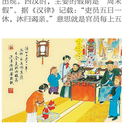
清代过年场景(资料图片)。

春节快到了，最让人开心和期待的除了年终奖，恐怕就是7假期了。那么，古人遇上诸如春节这样的大日子，是如何放假的？ 秦汉：休假制度初具雏形 作为中国历史上第一个实现了大一统、开启了诸多先河的封建王朝，秦朝却没有法定节假日，也没有具体的休假制度，如果遇到特殊情况，需要提前请假，经皇帝或相关部门的批准后方可离开。秦时的官员请假称“告归”，告归主要有两种情况，一是因疾病需要回家休养，二是身体老迈需告老还乡。 正式的休假制度一直到西汉时才出现。西汉时，主要的假期是“周末假”。据《汉律》记载：“吏员五日一休，沐日谒亲。”意思就是官员每上五天可以休息一天，这一天被称作“休沐”。因为当时朝廷要求各级官员集中在官衙办公和食宿，没有特令，平常不得回家，只有到了“休沐”，才可以洗浴更衣，回家团圆，打扫卫生或走亲访友，所以这种休假制度也被称作“五日休”。 汉朝官员还享有各种节令假，如冬至、夏至、春节等。此外，遇到特别的事情，官员可告假，告假又分为予告和赐告两种。予告可带职休假，但不得归家；赐告则是因为生病给予的假。汉制规定，凡请假三个月就要被免官，只有经赐告者才可延长假期而不会被免官。