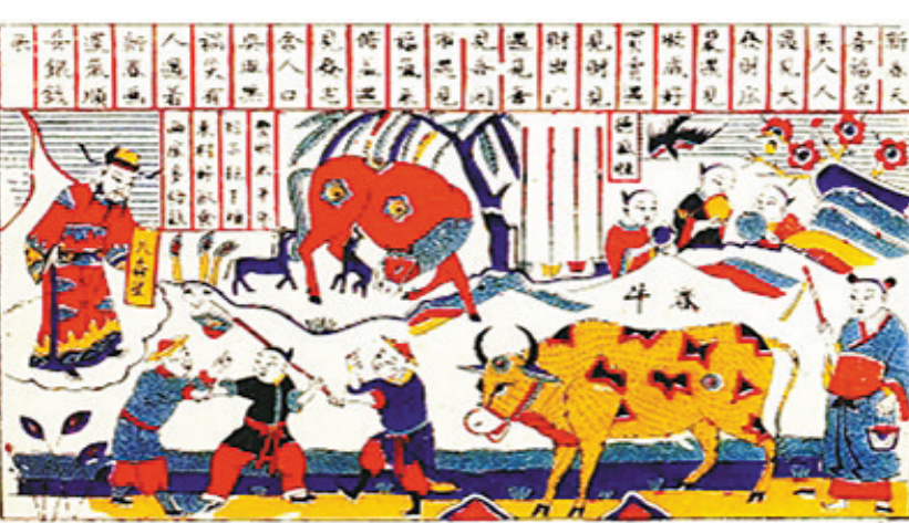
清代山东潍坊杨家埠年画《春牛图》。

关于“东方”与“春”的哲学关系，日本汉学伏见氏撰《尚书大传》：“东方者何也？物之动也。物之动何以谓之春？春出也物之出也，故谓东方春也。”而古人将二十四节气中的第一个节气称为“立春”，也在“物之动也”的说法里。所谓“立”，建立的意思，引申为开始；“春”呢，《尚书大传》称：“春，蠢也，物蠢生，乃动运。”所谓“立春”就是到了生物蠢蠢欲动的时候。 秦汉人崇东方，当时的宫殿和在考古中发现的这一时期墓葬几乎全部“面东”，故对四季中的“春”也推崇万分：“春者，天地开辟之端”，民间更有“春朝(立春)大于岁朝(正月初一)”之说。因为对“春”格外重视，古人视立春为“岁始”，过“岁节”往往比过“年节”的声势还大。从周代到清末，都以“立春”为一岁的大典，民间有“立春大过年”的谚语。古人对何时立春、阴历年有无立春都特别在意，立春节气还有“迎春礼”“祀春神”“进春山”“鞭春牛”“咬春饼”“戴春花”“占春兆”等一系列全民性活动。 二十四节气是根据地球绕太阳周年运动而制定的，立春一般在2月4日前后，而在阴历以月球绕地球周期为基础，与阳历有约11天差距。为此，古人通过增加月份，即“闰月”来调整，以便阴历与阳历在寒暑变化上保持基本一致和协调。但这样的后果就是有的阴历年份没有立春，而有的年份则有两个立春。 没有立春节气的年份，俗称“无春”年。春是生机，无春则无生机。在民俗文化中，“春”还有男女繁衍生育的寓意，因此古时还有“无春年不宜结婚”的迷信说法。具体到2018戊戌狗年，立春在2017年丁酉鸡年腊月十九(阳历2018年2月4日)，也就是说2018年阴历岁首无春，但因为2018年岁尾有春——即在腊月三十(除夕，阴历2019年2月4日)刚好有一个立春，“咬”到2019己亥猪年的立春，所以并不是“无春”年。 据《北京晚报》