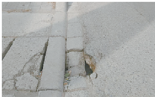
淞江路与大白山北路交叉口向西120米路南,路面破损。