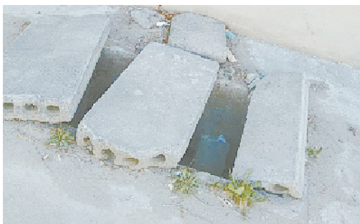
长江路与白云山中路交叉口附近,污水盖板移位。