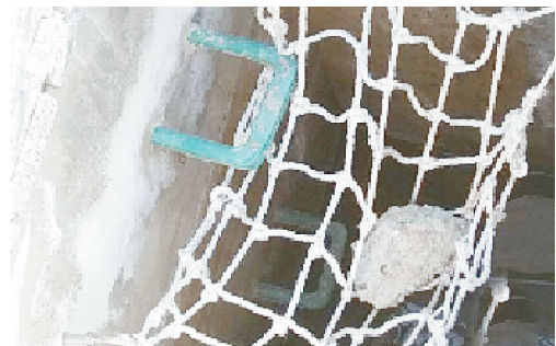
云翠山路与龙江东路交叉口附近,窨井盖缺失。