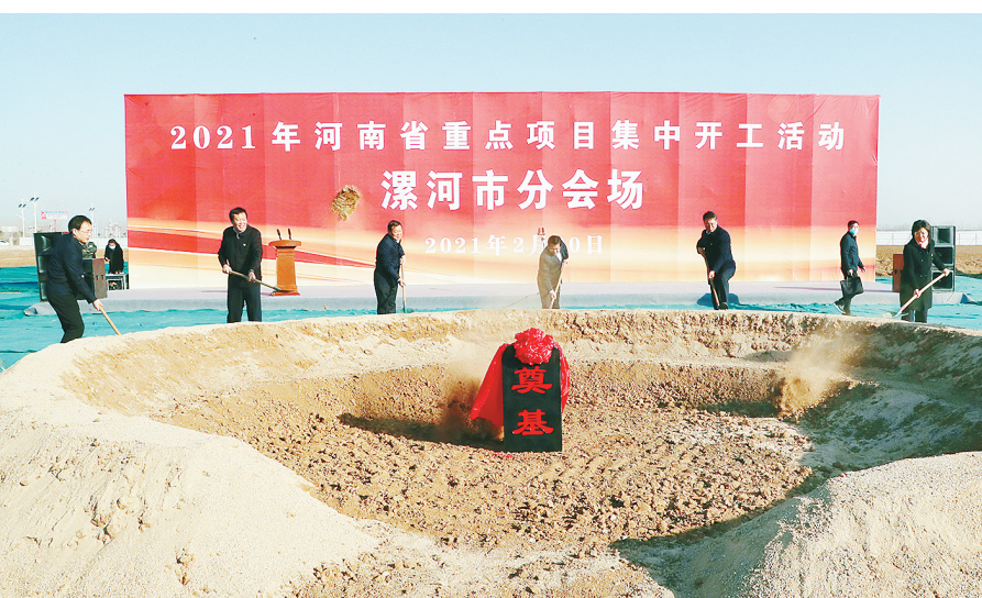
2月20日，我市举行2021年第一季度重点项目集中开工活动。

本报讯（记者 谢晓龙）春回大地生机勃勃，项目建设热潮涌动。2月20日上午，我市举行2021年第一季度重点项目集中开工活动暨临颍县精密制造产业园东区项目奠基仪式，市委副书记、市长刘尚进主持，市领导李思杰、吕岩、高喜东、李建涛参加。蒿慧杰首先代表市委、市政府对全市重点项目集中开工表示热烈祝贺，向来漯投资兴业的各方嘉宾表示诚挚欢迎，向项目建设付出心血和汗水的广大干部群众表示衷心感谢。他指出，项目建设是高质量发展的“牛鼻子”，是“十四五”开好局、起好步的“硬支撑”。近年来，市委、市政府牢固树立大抓项目、大抓招商的鲜明工作导向，以项目承载投资、优化结构、改善民生、提升城市品质，不断增强发展新动能、增创竞争新优势，致力推动更高标准、更深层次、更广领域的开放