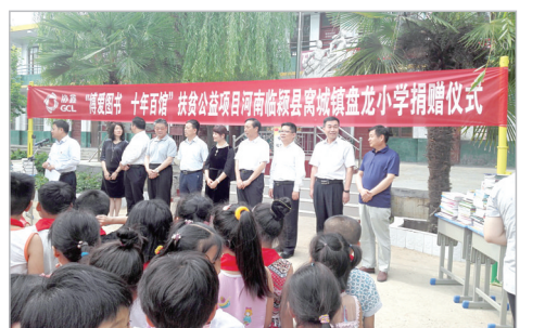
民革漯河市委开展资助助学活动现场。

扶贫工作,既要扶好“身贫”,又要扶好“心贫”。在帮扶过程中,市政协立足长远,扶智扶志又扶心。指导派驻第一书记宣传党的方针政策,让群众进一步了解各项惠民政策,