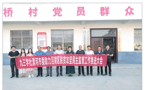
九三学社漯河市委助力召陵区脱贫攻坚工作推进会召开后合影。