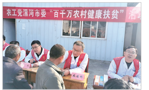
农工党漯河市委开展“百千万农村健康扶贫”活动现场。