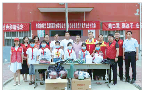
民建漯河市委开展教育扶贫活动。