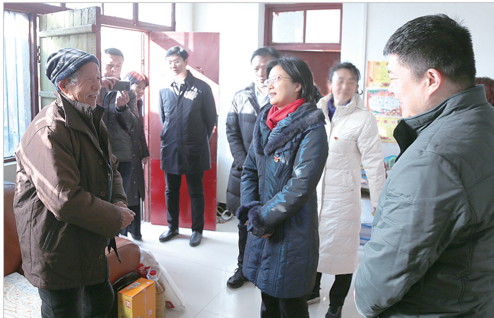
市政协主席吕岩(右三)慰问困难群众。

近年来,市政协深入学习贯彻习近平总书记关于精准扶贫、精准脱贫的重要讲话和重要指示批示精神,按照中央和省、市委的决策部署,聚焦2020年打赢脱贫攻坚战、全面实现小康社会战略目标,注重发挥政协优势,主动担当作为,组织政协各参加单位、各级政协组织和广大政协委员积极投身脱贫攻坚战,履职尽责干实事、凝心聚力献良策,书写了脱贫路上精彩政协答卷。