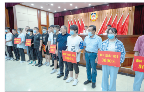
市工商联“民企助学”活动现场。

各县区政协因地制宜、精准施策,在助力打赢脱贫攻坚战中大显身手、出力、出实招。如临颍县政协常年举办送文化、卫生、科技、法律“四下乡”和“助力脱贫攻坚,展示委员风采”活动;舞阳县政协持续开展“三包三联”活动,就如同摘掉省定贫困村帽子,倾力助推全市精准扶贫、精准脱贫工作。