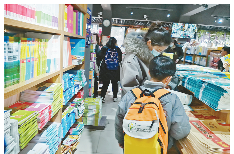
3月1日,记者在市区多家文具店、书店看到,不少家长趁放学时间,带着孩子前来选购学习用品。近段时间,各类文具、教辅用书等迎来销售小高峰。

活动分为线上、线下两种竞答模式。市民可关注漯河市妇联微信公众号答题,也可参加街道办事处组织的竞答活动,赢取奖品。